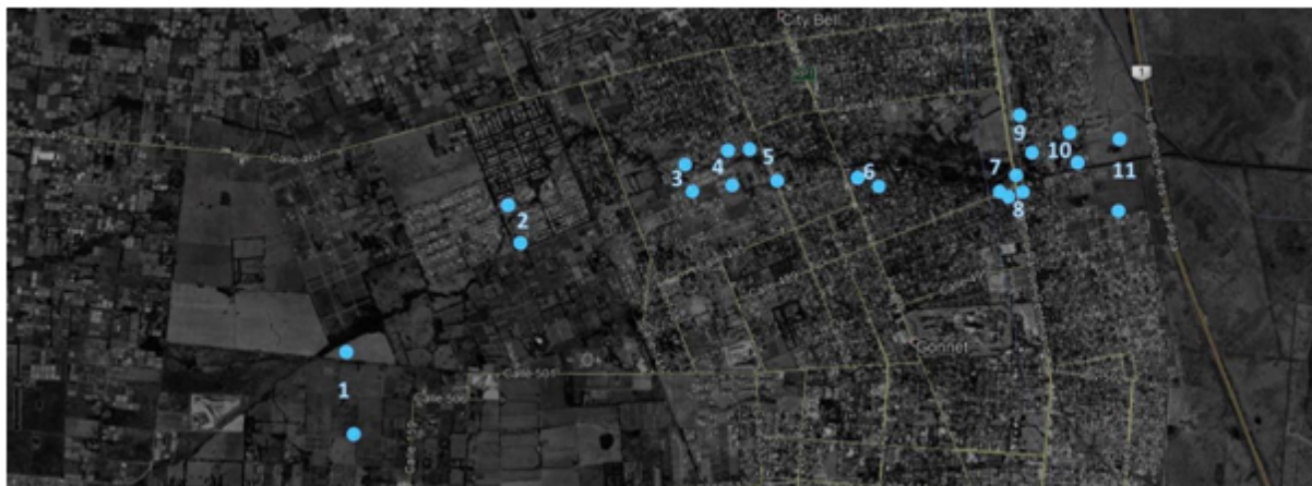
FIGURA 4 Localización de los pares en A° Rodríguez