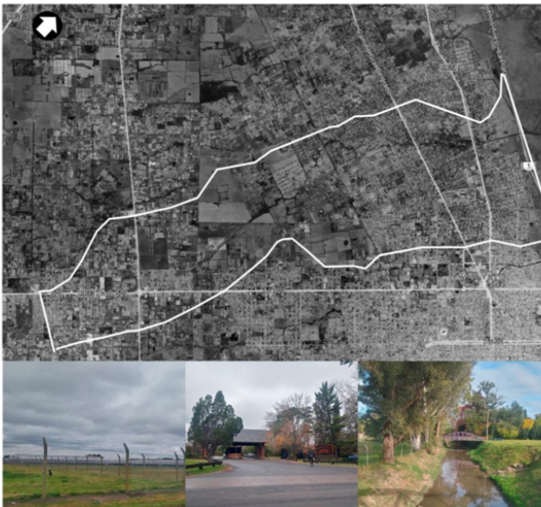
FIGURA 2 Cuenca del arroyo Rodríguez