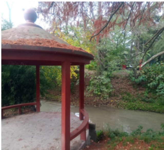
FIGURA 5 Barrio Nirvana