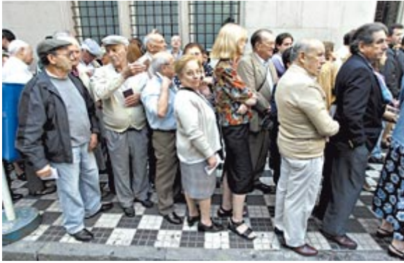
Argentinos haciendo cola en el Consulado español en Argentina