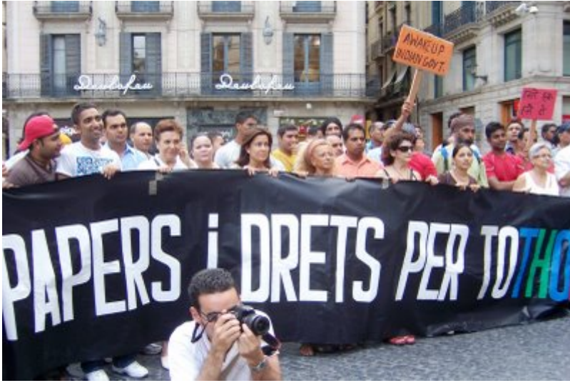
“Papeles y derechos para todos y todas”