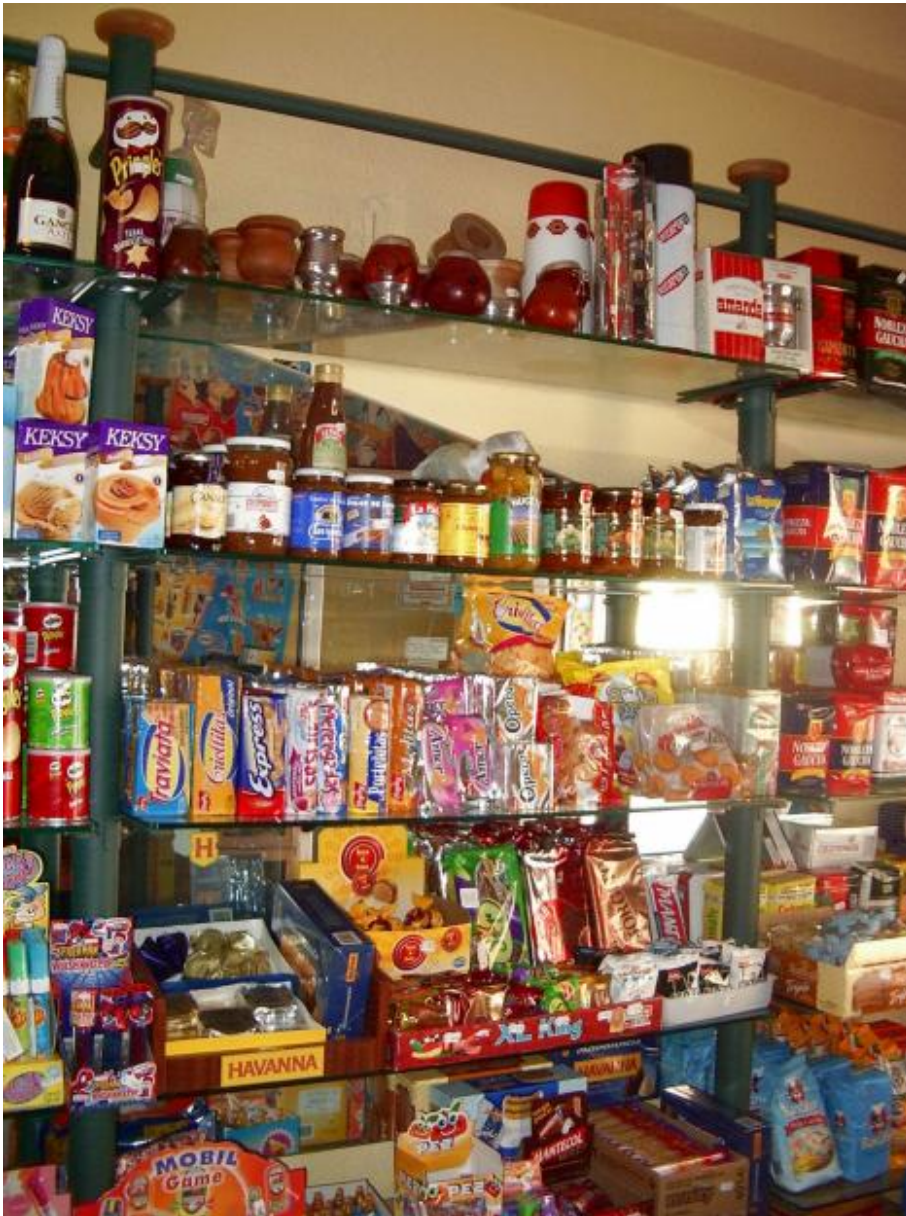
Productos argentinos en España