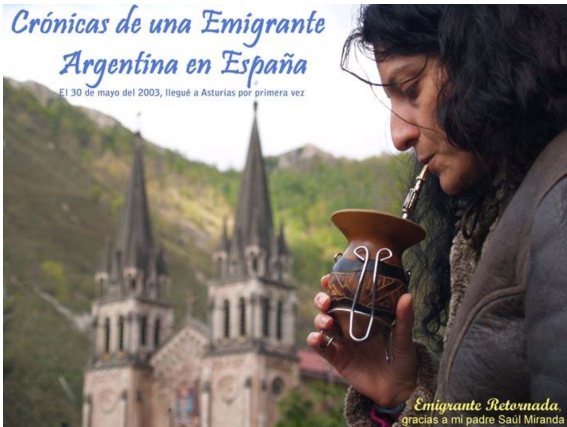
Historia de una emigrante en España