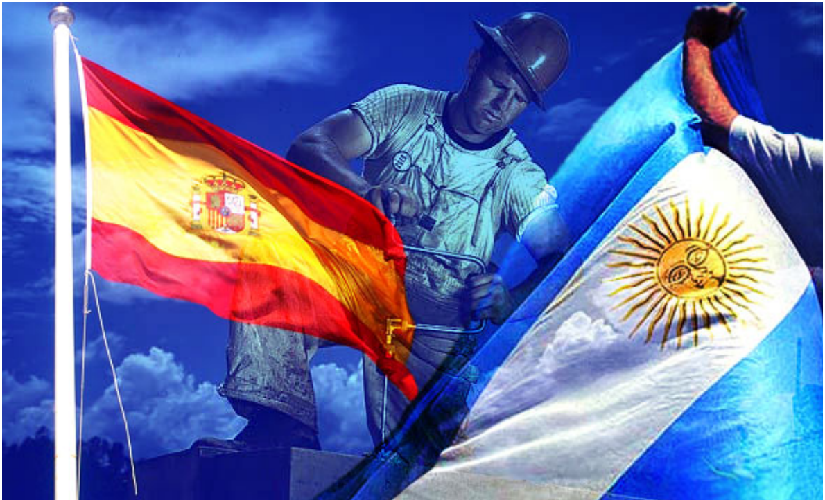
Banderas argentina y española