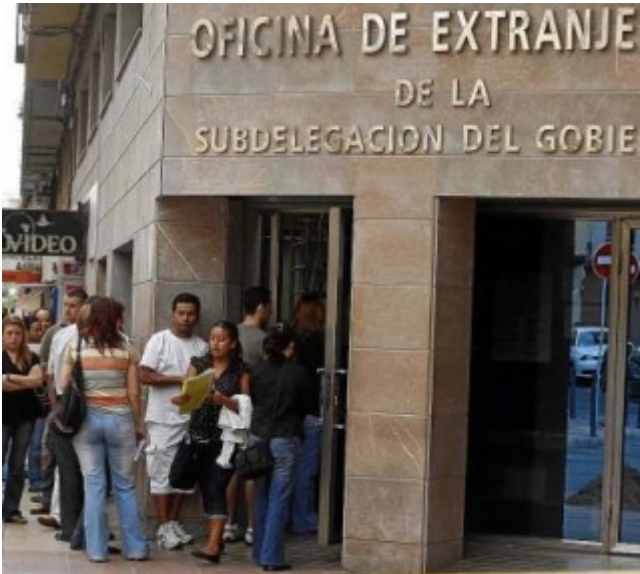
Argentinos haciendo cola en la oficina de Extranjería