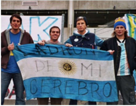
Argentinos en España