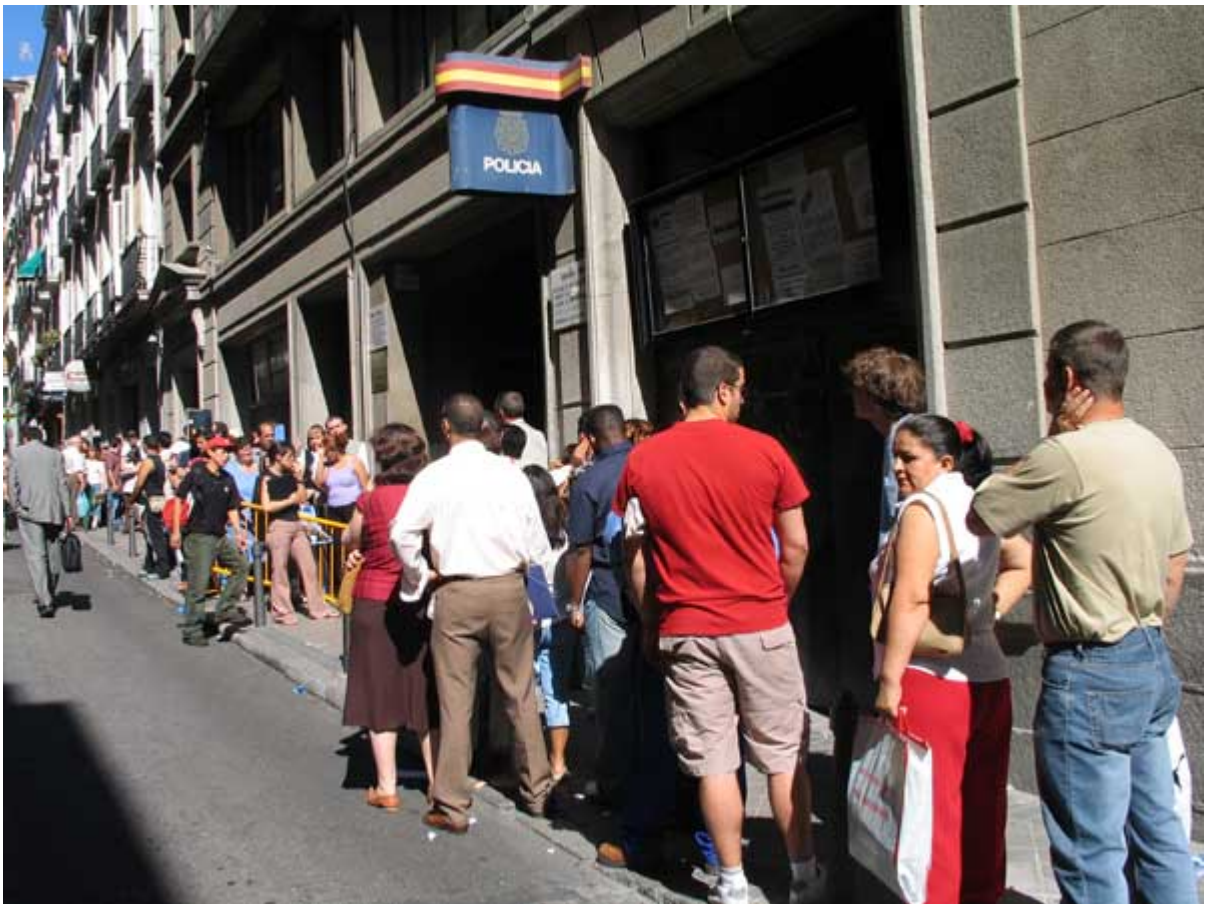
Argentinos haciendo cola en la oficina de Extranjería