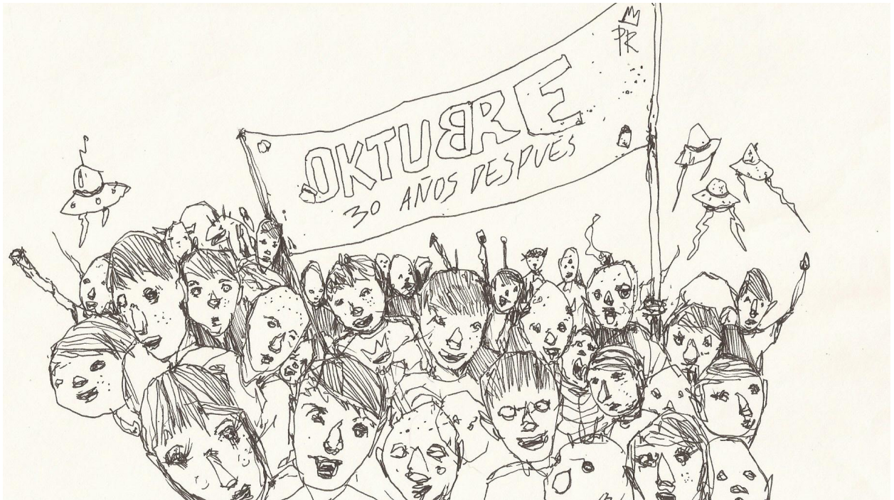
Dibujo original "Desde Octubre", Valentino Tetamantti

Consideraciones: En este sentido, la cubierta que acompaña el documental, fue elaborada artesanalmente para su presentación y cuenta con una ilustración realizada por Valentino Tetamantti de manera especial para esta edición.