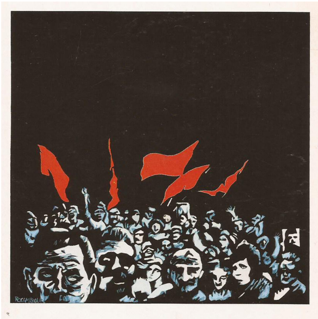
Tapa original de Octubre (1986)