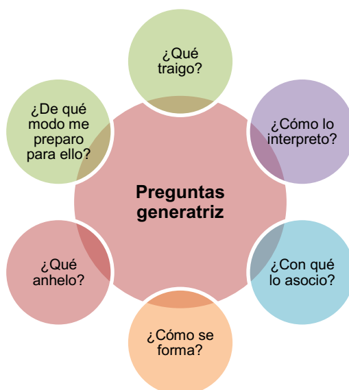
Figura 2. Preguntas generatriz en el ciclo de formación

De este modo, en este devenir se van entrelazando interrogantes-clave (Figura 2) que, formulados por los sucesivos equipos docentes, alientan a hilvanar el desarrollo de los temas e invitan a ver necesidades o limitaciones que conducen a nuevas búsquedas, como dicen Ciccioli y Sgreccia (2019) preguntas generatriz que pivotean el despliegue.