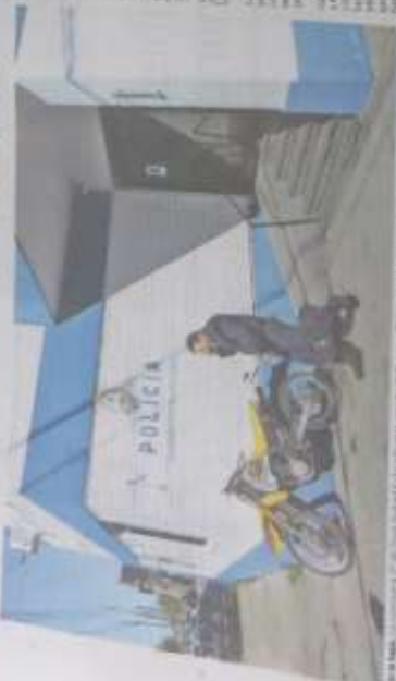
En Dock Sud, la comisaría de la calle 10 y el 10 de Mayo, con capacidad para 12 detenidos, fue el lugar donde se produjo el incidente.

• Las autoridades dijeron que los otros agentes estaban en un operativo. El lugar tiene capacidad para 12 presos.