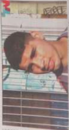
El juez liberó a uno de los detenidos por la desaparición de Melina. También se apartaron a un fiscal.