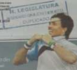
H. LEGISLATURA DISTRIBUCIÓN GRATUITA EN ESTABLECIMIENTOS EDUCATIVOS DUPLICADO

EDICIÓN: 1.000.000 DISTRIBUCIÓN GRATUITA EN LOS ESTABLECIMIENTOS EDUCATIVOS