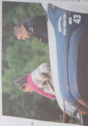
Personas inspeccionando el interior de la camioneta de Melina.

• Tiene unos 40 años y lo apodan "El Navigón". Según los otros tres implicados, habría matado a golpes a la adolescente tras una "fiesta" de sexo, drogas y alcohol. Siguen rastreando el cuerpo en un arroyo.