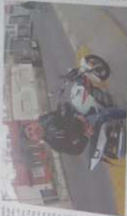
El video muestra a un turista canadiense siendo atacado por un motociclista en La Boca. El video fue grabado por la propia víctima.

La grabación fue hecha por la propia víctima. Un canadiense, con una cámara en su casco. Un motociclista lo atacó cuando iba en bicicleta. Según los vecinos, los asaltos son cotidianos en la zona.