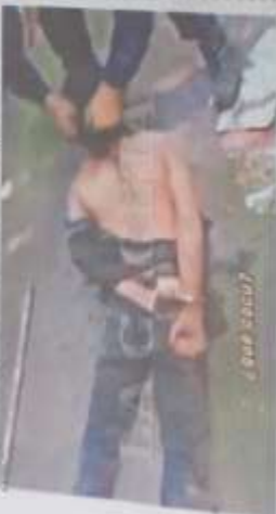
El video muestra a un policía golpeando y pateando a un detenido en el suelo.

La Prefectura de la fuerza provincial investigará el escándalo luego de que se viralizó un video que muestra a un policía torturando a un preso en Tucumán. El video, que fue grabado en un celular, muestra a un policía golpeando y pateando a un detenido en el suelo. El video fue grabado en un celular y se viralizó en redes sociales.