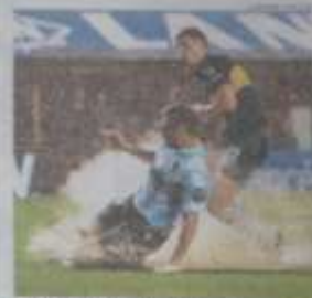
FALSADE POR AGUA. CAIEN EN NORDELTA EL GOL.

"Necesito su ayuda" Se lo pidió en agosto Cristina al Papa por la deuda