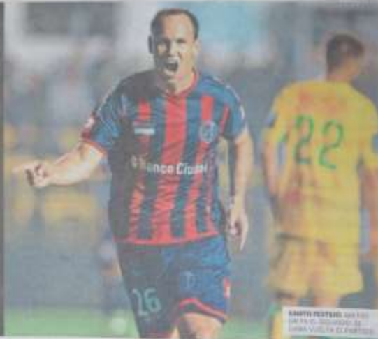
MIÉRCOLES 23 SEPTIEMBRE DE 2016 NARRA POR EL FOTÓGRAFO DE LA PÁGINA 10

► El equipo de Varela Le tramitaban una visa para viajar, pero Martino no le llamó