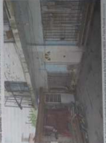
Templo. El templo católico de San Isidro es el lugar donde se cree que se llevó a cabo el crimen.

La investigación se prolongó durante meses. En ese momento, apareció una nueva testigo que dijo que vio cuando subían a la víctima al coche. También intentan ubicar a un hombre que estuvo en el templo donde habría sido el homicidio.