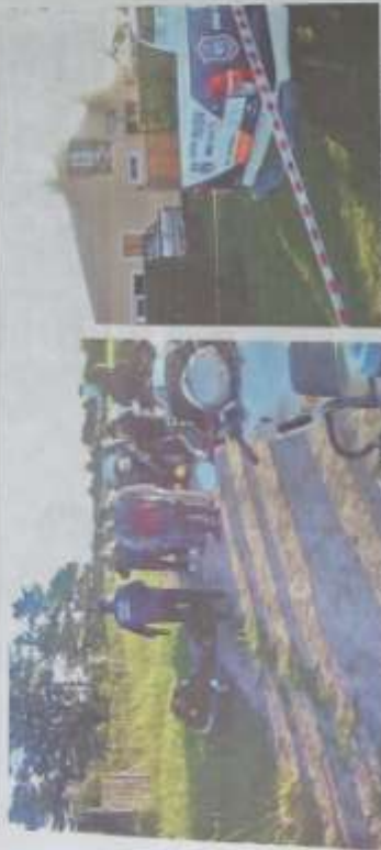
Las víctimas habrían ido a pasar el fin de semana largo. Cuatro ladrones robaron en una casa vecina y luego se metieron en la de ellos. El hombre recibió un tiro. A su mujer le pegaron dos y está grave.