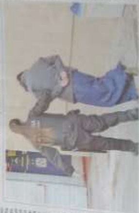
La Policía investiga el asesinato de un joven de 21 años, ocurrido el día de la comunión de su hijo. El asesino fue detenido en un intento de robo. La familia dice que fue un intento de robo, pero la Policía investiga una probable emergencia.

Con una banda que hacía secuestros y robos