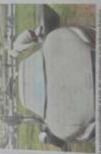
Rosario. Siguen las dudas por Palanini

Considera que la batalla clave es participar del sistema Caso Melina: el abogado de "Toto" pidió la nulidad de la investigación El abogado de "Toto" pidió la nulidad de la investigación en el caso Melina. El abogado de "Toto" pidió la nulidad de la investigación en el caso Melina. El abogado de "Toto" pidió la nulidad de la investigación en el caso Melina. El abogado de "Toto" pidió la nulidad de la investigación en el caso Melina. El abogado de "Toto" pidió la nulidad de la investigación en el caso Melina. El abogado de "Toto" pidió la nulidad de la investigación en el caso Melina.