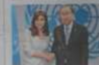
SABIDO A DEL CORRAL DEL MONTE

► Es el Electoral N° 1, clave en las elecciones primarias. Para cubrir la vacante de un juez fallecido fue designado un secretario muy cercano al kirchnerismo. >>>