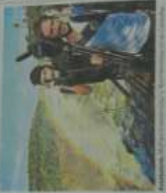
Un grupo de turistas disfrutando de un día en la naturaleza.

La Policía y el Ejército Argentino se comprometieron a brindar seguridad a los turistas que visitan el país. Los funcionarios afirmaron que, a pesar de los desafíos, seguirán trabajando para garantizar la seguridad de todos los visitantes.