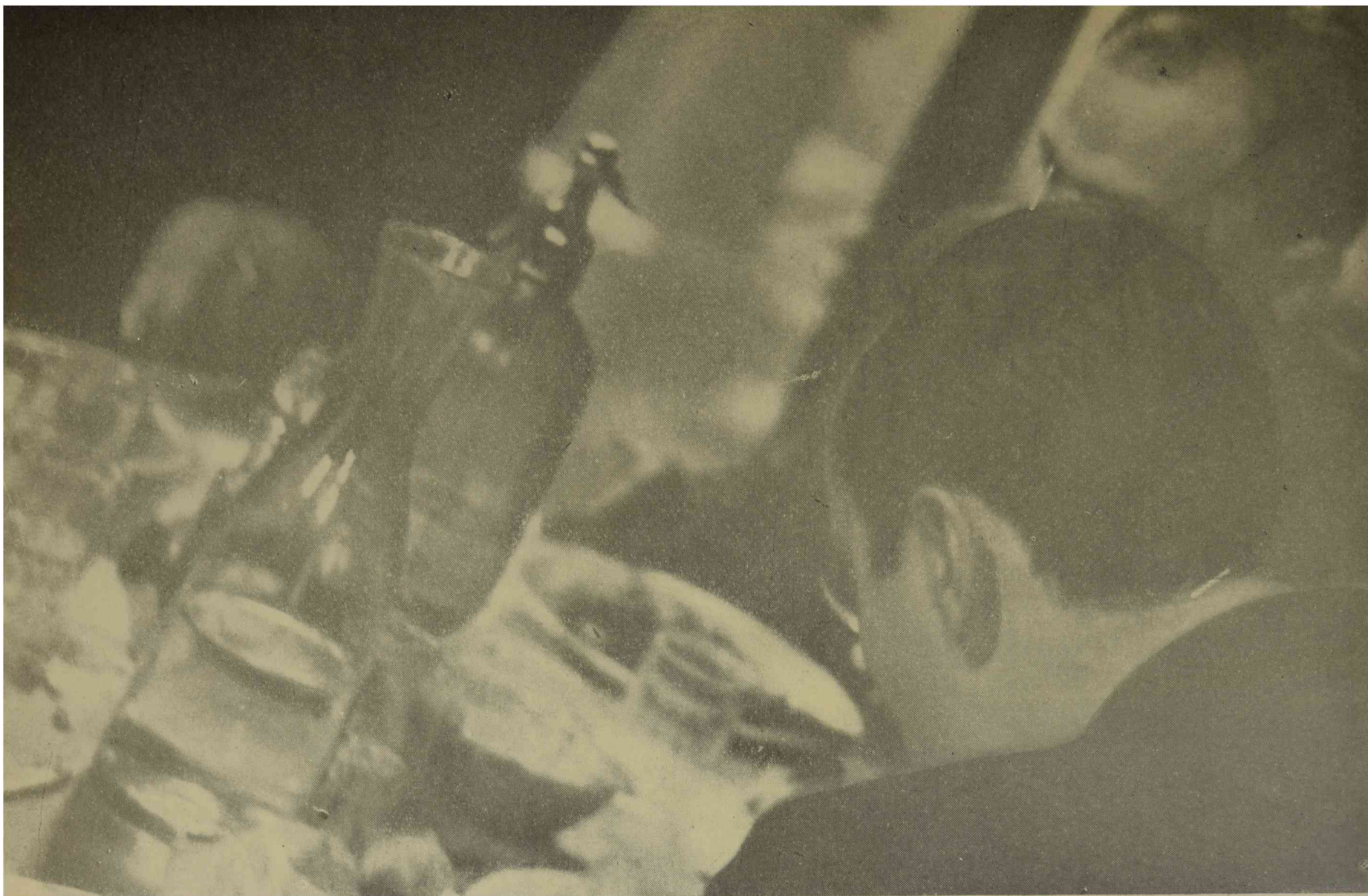
Rincón del comedor universitario.