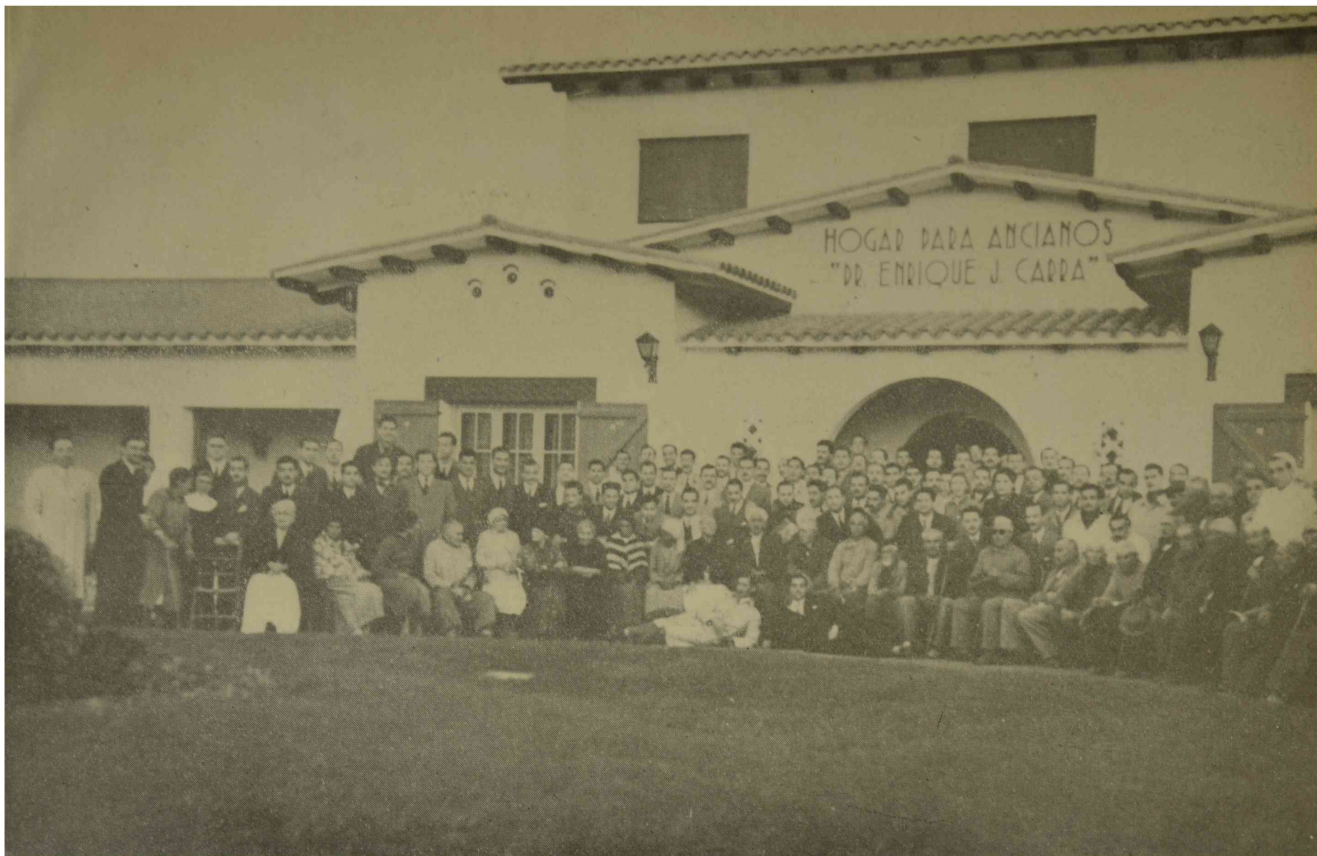
El Coro, en el hogar para ancianos de San Francisco (Córdoba)