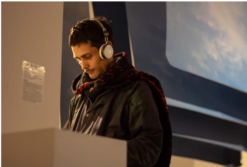
Figura 5. Zaira Allaltuni. Donde quiero estar. La invención de una cartografía deseante (2019). Fotografía de Sol Tavernini