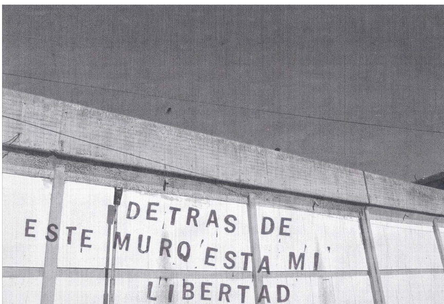
Figura 3. Zaira Allaltuni, Imagen e intervención con texto realizada por una participante del Taller de Cartografías Colaborativas (2019)