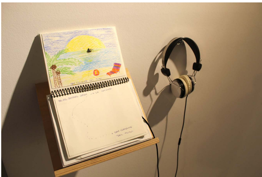
Figura 6. Zaira Allaltuni. Donde quiero estar. La invención de una cartografía deseante , (2019)