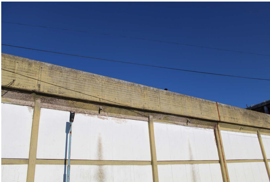
Figura 2. Fotografía tomada por un participante del Taller de Cartografías Colaborativas, Imagen capturada desde el patio de "Las casitas" (2019)