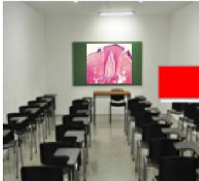
IMAGEN HISTOLÓGICA EN CLASE TEÓRICA

REDUCCION DE LA DISOCIACIÓN TEORÍA- PRACTICA EN LA CLÍNICA- EVALUACION PARA LA RECUPERACIÓN DE TEORIA EN CLÍNICA