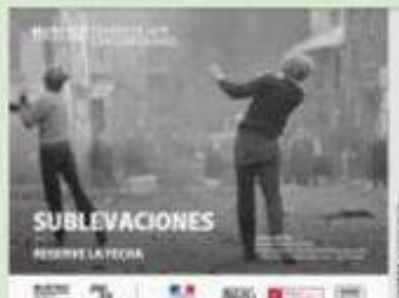
"Sublevaciones" (2017) Georges Didi-Huberman.