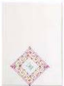
"Restitución" (2017) Sebastián Hacher.