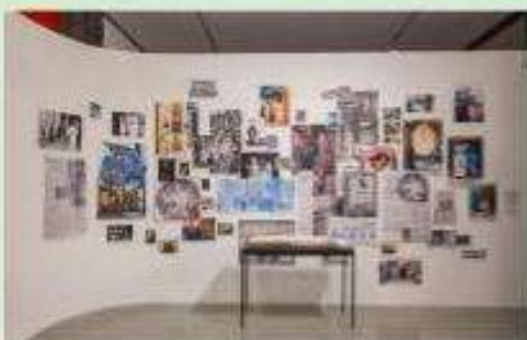
"Liliana Maresca: El ojo avizor" (2017) MAMBA.