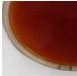
EXTRACTO ETANÓLICO DE PROPÓLEOS