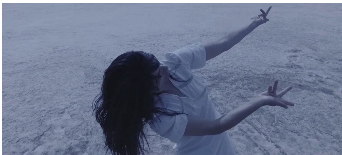
Figura 4. Inside (Inhabited Landscapes) [Videodanza] de Carmen Porras (2017).

A diferencia de la corporalidad del personaje de la escena final de Stalker , los movimientos de las intérpretes son inquietos, al igual que los de la cámara. El cuerpo se mueve mientras la cámara se aleja y acerca. Los personajes recorren el espacio con un caminar danzado, un paso rítmico y poético. Las intérpretes estiran sus brazos y piernas, los enredan, danzan y se desplazan en el espacio y se relacionan con los elementos: vestuario, libros, escaleras, estanterías, mesas, sillas, barandas, puertas, etc. La cámara danza con los cuerpos, los sigue y los encuentra.