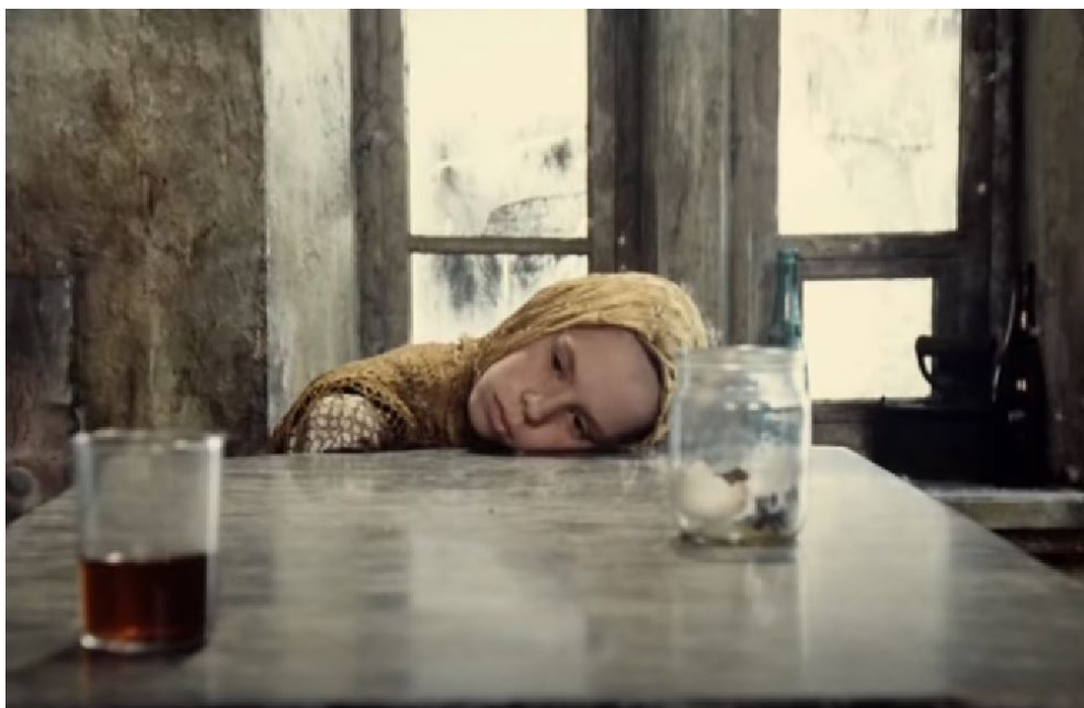
Figura 1. Stalker (1979) de Andréi Tarkovski.

Para esto, traigo un recuerdo de la cursada de Realización I. En una de las clases se proyectó la escena final de la película Stalker (1979) del antedicho director. La escena nos muestra a Monkey (personaje de la niña) leyendo un poema de Fiódor Tiútchev que se recita en voz en off.