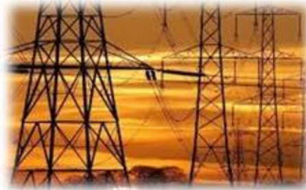
Red de transmisión de energía eléctrica