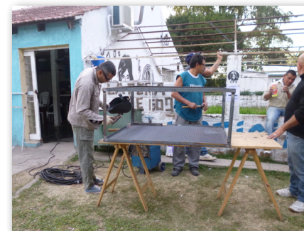
Taller de Herrería "La Peña de 609"