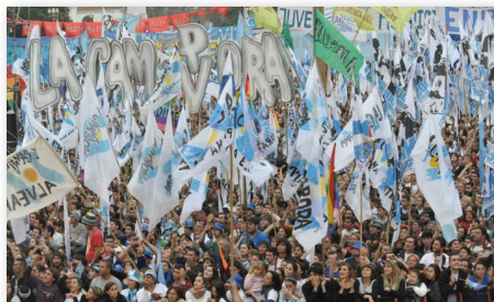
Movilización de La Cámpora. Acto 25 de Mayo.