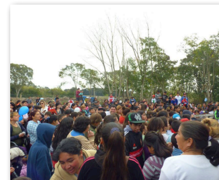
Jornada del Día del Niño. La Peña de 609. Agosto de 2014