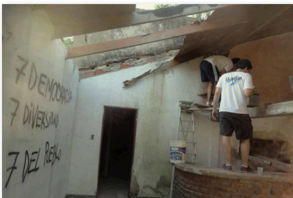
Proceso de construcción de la La Peña de 609.

tiempo estimado de diez meses, constituyó un hito para los militantes de “La Peña” por varias razones. Por un lado, porque les permitió ir estableciendo un vínculo con los vecinos antes de empezar el trabajo propiamente territorial: “teníamos relación con los vecinos en función de la construcción, no teníamos agua, entonces le pedíamos a la vecina de enfrente. Al del supermercado le comprábamos la comida para todos. Íbamos conociendo a los actores del barrio en la medida que íbamos haciendo la construcción (...) eso fue positivo porque durante meses, los vecinos nos vieron laburar y todo el barrio vio el proceso de cambio de ese lugar y vio siempre los mismos autos estacionados en la puerta, la misma gente” (Entrevista a Sebastián, miembro de La Cámpora. Noviembre de 2013).