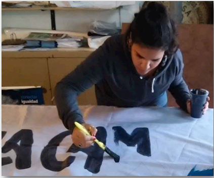
Preparación y armado de banderas de "La Peña de 609". Previo al acto de 25 de mayo.