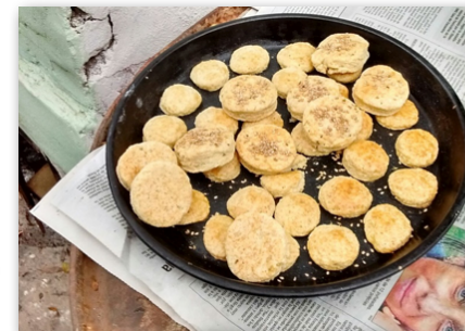
Taller de Panadería. La Peña de 609