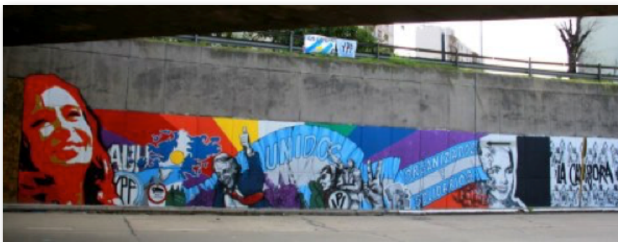
Foto publicada el 27 de septiembre del 2012 por la Asociacion Civil “Red Cultural Carpani”.

Argentina continua y a esta altura se leen la inscripción “unidos, organizados y solidarios” en ella. Le sigue la imagen grande de Eva Duarte, a la cual antecede una imagen en menor tamaño de Juan Perón. Luego el mural toma un negro intenso y a continuación un fondo blanco con muchos “Nestornautas” en borde negro, en el medio, también con letra negra dice “La Campora”.