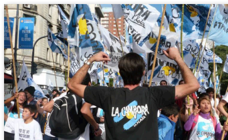
Acto del 25 de Mayo.