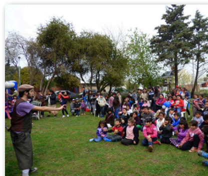
Jornada del Día del Niño. La Peña de 609. Agosto de 2014