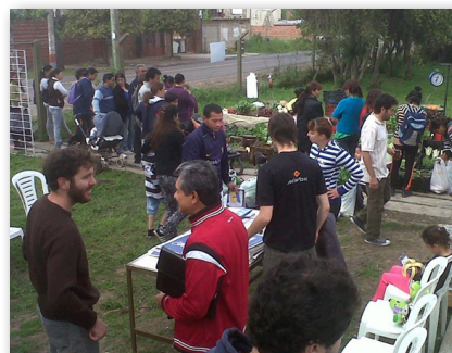
La Peña de 609. "Programa Frutas y Verduras para todos". año 2013.