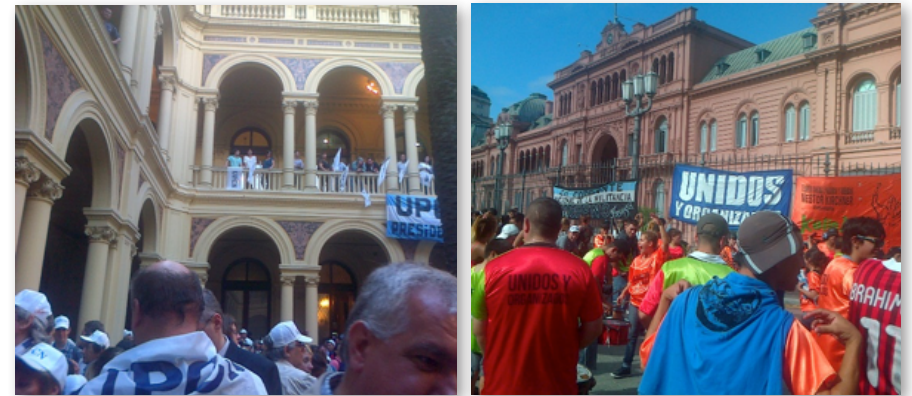
Movilización del 20 de noviembre de 2013. Jura del nuevo Gabinete de la Nación.