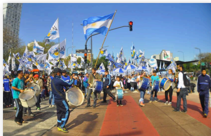
Acto del 25 de Mayo.