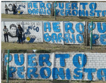
"Gracias por ser mi amigo" era la frase que, "Julito" le decía a cada uno de los compañeros de "La Peña". El mural fue realizado en su memoria por los vecinos del barrio y los militantes.