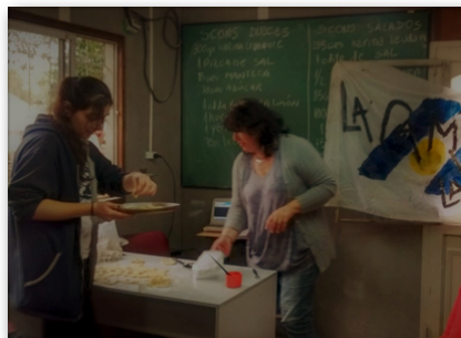
Taller de Panadería "La Peña de 609"