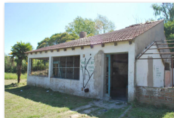
La Peña de 609. Un reflejo de la década de los `90.

Fue así como a principios del 2012 firmaron un contrato de comodato del lugar. De esa manera, se involucraron en el armado y restructuración de un lugar propio, al que llamaron “La Peña de 609”.