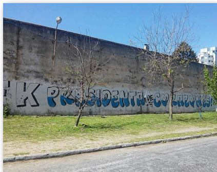
Pinta de paredones. Previas a la contienda electoral.