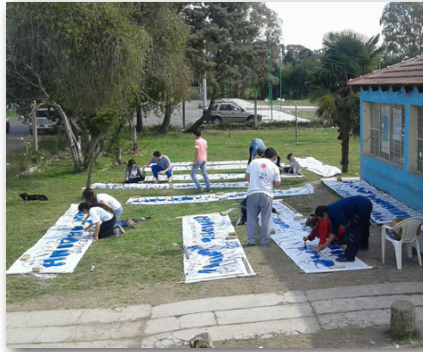
Pintada de pasacalles. Previo elecciones.