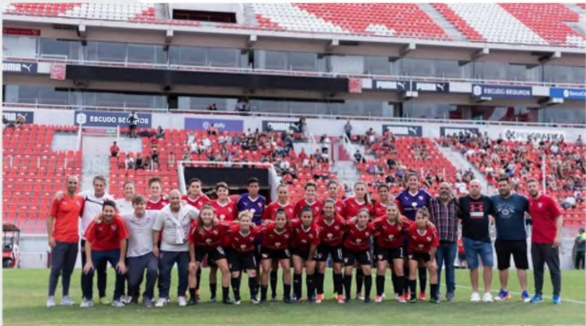
Plantel del Club Atlético Independiente

"Comparando con mi niñez, antes era difícil; no había escuelitas o donde aprender fútbol, no había clubes a nivel amateur, sólo pude probarme en Estudiantes, y por cuestiones de horario de escuela y al no tener la edad para ficharme, terminé dejando".