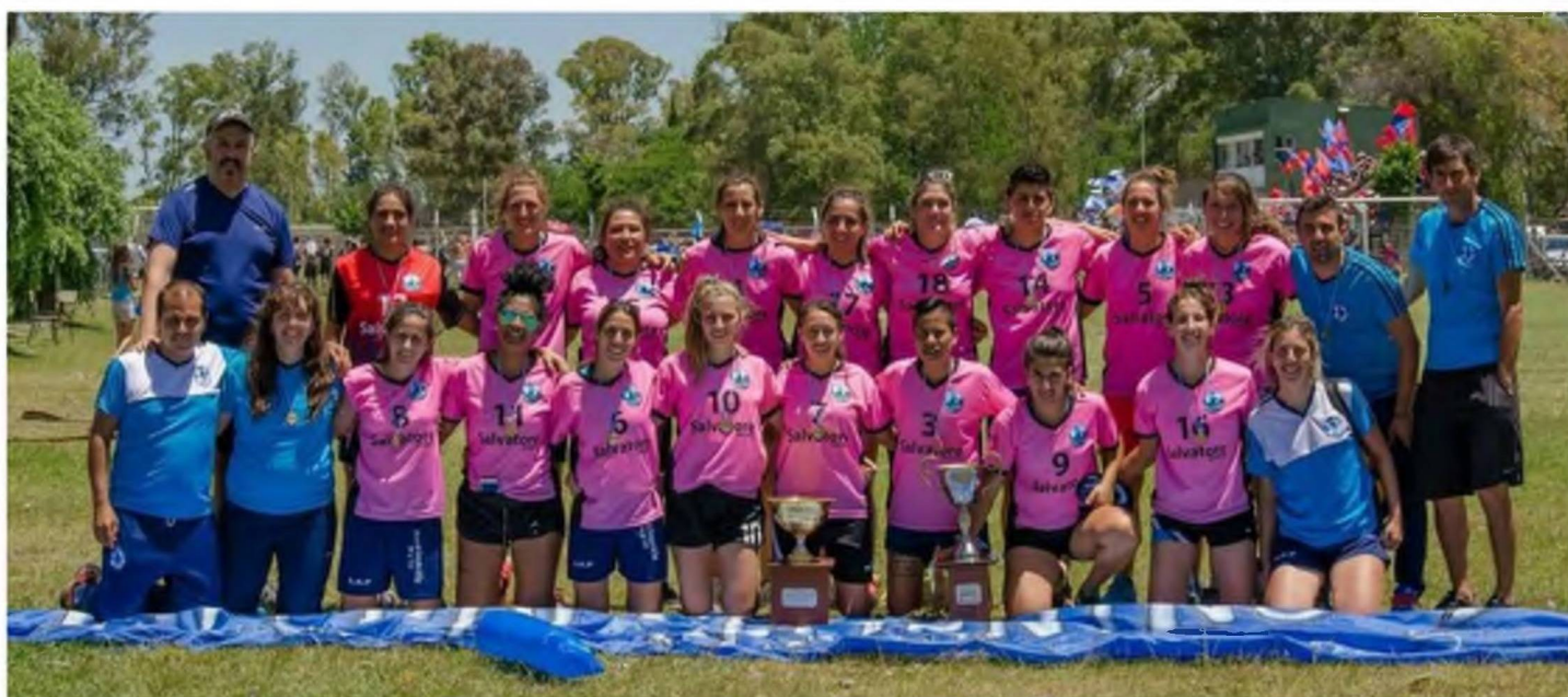
Plantel Las Bonitas - Campeón Nacional Trelew 2017