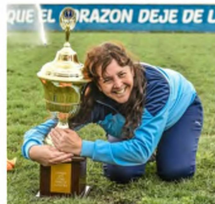
Olavarria - Trofeo provincial 2018

"Se creó y se construyó el espacio que la mujer necesitaba para desarrollarse como jugadora, para tener sentido de pertenencia a un club y que hoy la liga cuente con un plantel mayor de jugadoras, un seleccionado, y sea un semillero para clubes de AFA" .