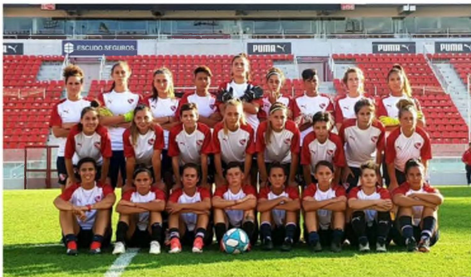
Plantel Club Atlético Independiente