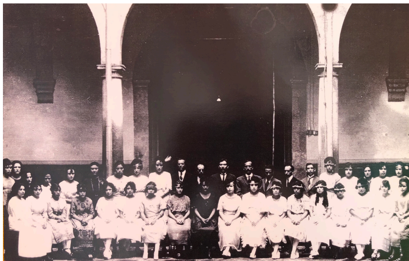
Figura 4. Profesores y alumnas de la Academia de Niñas.