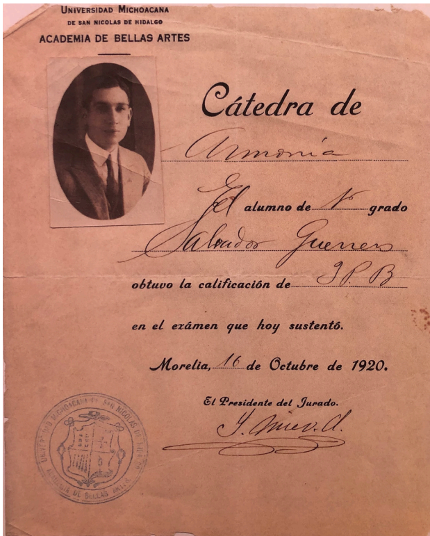
Figura 5. Acta de examen de armonía de Salvador Guerrero Monge.

La figura 5, comprueba varias cosas respecto a la formación musical de Salvador Guerrero Monge que se irán desglosando a continuación. En primera instancia, aclara perfectamente y deja fuera de cualquier duda que, parte de su formación académica estuvo dentro de la Academia de Bellas Artes (hoy Facultad Popular de Bellas Artes) de la Universidad Michoacana de San Nicolás de Hidalgo.