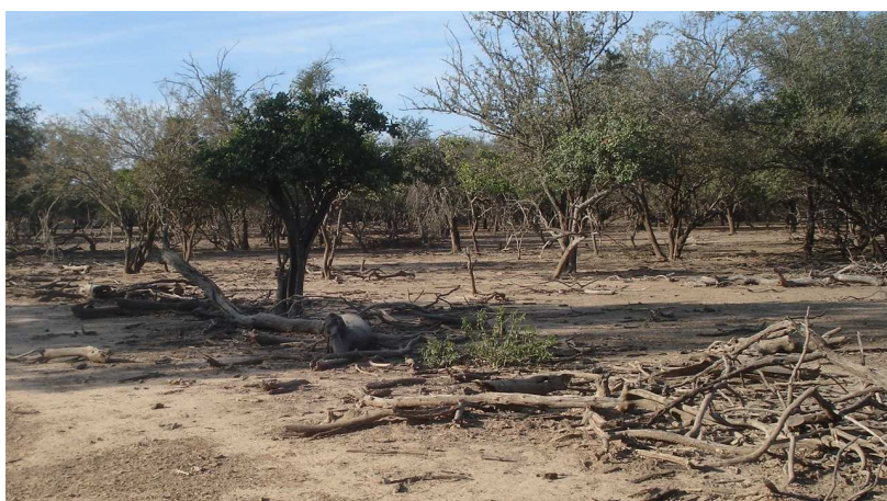
Figura 3: Leña esparcida por el suelo al pie de los árboles de la zona del municipio Santa Victoria.

La fotografía de la figura 3 muestra el panorama que se presenta al circular por los caminos de tierra de la zona, donde se observa la abundante leña esparcida por la caída debido a vientos.