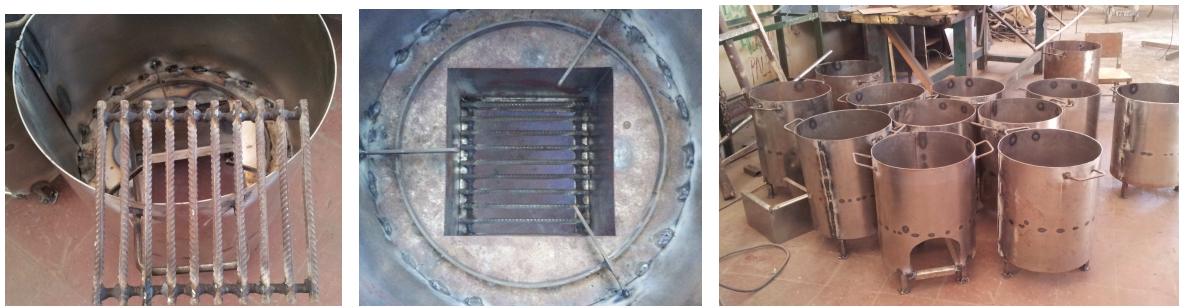
Figura 5: Detalles del cenicero, base de apoyo de la olla y cocinas producidas en la herrería de la institución.

Este proceso inició con la capacitación brindada por técnicos en los talleres del INENCO a los jóvenes, quienes replicaron la construcción en los talleres del Instituto Michel Torino, ubicado en el pueblo de Chicoana, de la Provincia de Salta. En dicho instituto los jóvenes cuentan con una herrería, para la cual el proyecto financió los elementos necesarios para llevar a cabo la construcción de las cocinas a leña, tales como las chapas de hierro, perfiles para los ceniceros, insumos para soldar y discos de corte. Las fotografías de la figura 5 muestran lo producido en cocinas a leña, denominadas también braseros optimizados.