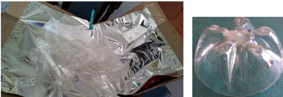
Figura 6: cocina solar de cartón a partir de una caja. Derecha: soporte de PET para olla.