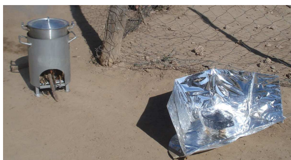
Figura 1: Fotografía de la cocina solar y brasero optimizado.

La actividad de visita de campo a los pueblos de la margen salteña del Pilcomayo se realizó en agosto, durante cinco días, portando una cocina solar de cartón y un brasero a leña, como indica la fotografía de la figura 1.