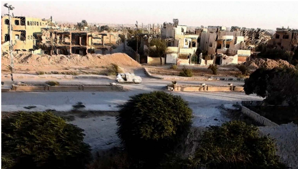
Figura 2: Weber, plano general del coche bomba, Homenaje a la obra de P. H. Gosse . (2020)

Esta atención no localista al territorio, sin renunciar a sus marcas más identificables, como la ostensible tonada del narrador, brinda un espesor distintivo a los planos rugosos por la manipulación. Tal arrugamiento permite, paradójicamente, restituir la potencia indicial. Acaso el ejemplo más patente de esto sea la secuencia del martirio en Homenaje... Describiendo las disputas mediáticas del Estado Islámico, Weber reactualiza la discusión por la figura del mártir como máximo pico de la relación con lo real. La operación implica un manejo pleno de las exigencias de verdad para que esos martirios sean recibidos, así como su difusión por redes sociales y mezquitas, donde deben sortear diversas formas de censura humana y maquínica para alcanzar a quienes se procura enrolar y radicalizar. Esa forma extrema se constata en la secuencia que monta tomas desde el coche bomba desde fuera y una toma aérea desde un dron con un insert del plano desde una cámara personal que acompaña al conductor. [Figuras 2 y 3] El insert reconfirma que lo que está sucediendo es, de hecho, un ataque suicida: no hay montaje, los dos planos en pantalla se corroboran entre sí.