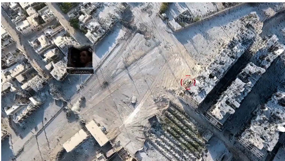
Figura 3: Weber, plano cenital del coche bomba con insert de cámara personal, Homenaje a la obra de P. H. Gosse . (2020)