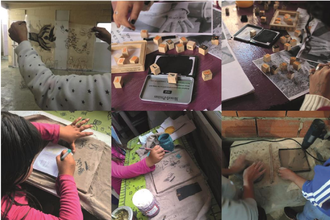
Imagen 2. Registro de los procedimientos artísticos y proyectuales, en los talleres de realización artística. Proyecto Microcartografías Prismáticas. Programa de Extensión Construyendo Lazos Sociales (UNLP), 2019-2020.