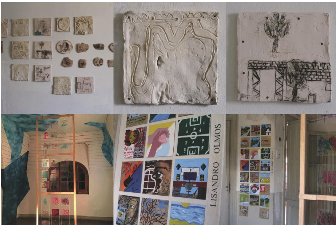
Imagen 3. Exposición en el Palacio Municipal López Merino, La Plata. Programa de Extensión Construyendo Lazos Sociales (UNLP), 2019-2020.