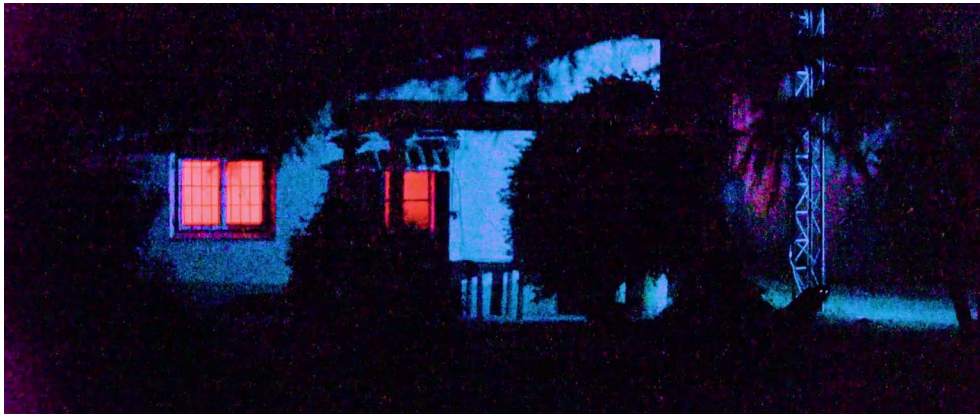
Figura 5. Biasotti, H., Cerana F. y Magneres A. (2022). Las formas de la noche en El aliento

Por último, y en relación directa con la textura de la imagen, propusimos que haya algunas secuencias con más ruido que otras, haciendo más difícil su comprensión y generando de esta manera una tensión dada por su compleja lectura, pero también por el dinamismo producido por la vibración del ruido en el plano [Figura 5]. Esta textura que lo invade todo, del mismo modo que el universo construido, resulta así inquietante y apabullante.