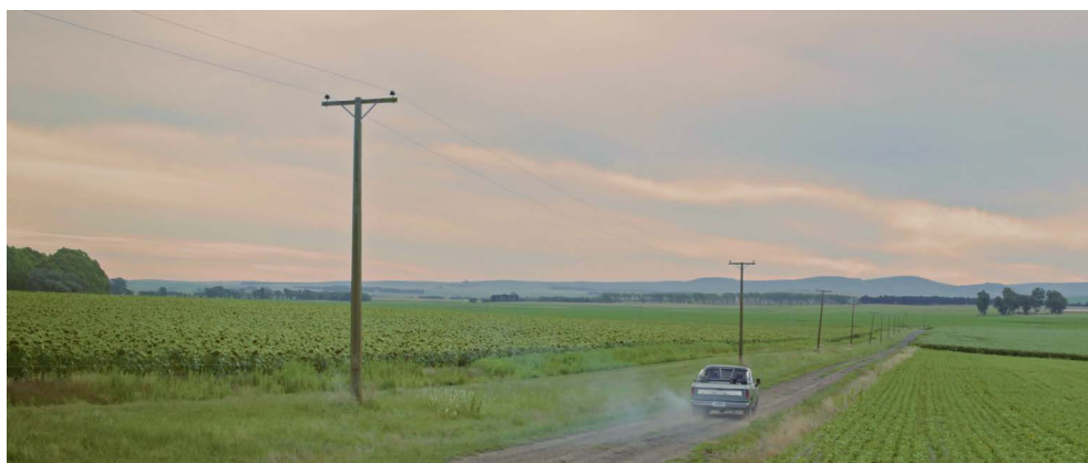
Figura 2. Biasotti, H., Cerana F. y Magneres A. (2022). El aliento . Primeros planos con una imagen más clara y sin ruido