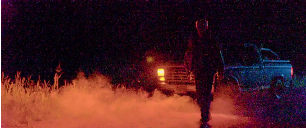
Figura 4. Biasotti, H., Cerana F. y Magneres A. (2022). Luces y humo en el campo de El aliento

que parecen emitir luz y los acantilados rocosos. Además, las fotografías de Jon Cazenave en sus series Numen (2012) y Herri ixilean (2010), donde se retrata un bosque haciendo énfasis en las texturas de la noche y las almas que la habitan; y las de Fosi Vegue en la serie XY XX (2014), en la cual el ruido de la fotografía digital se explota al máximo, exigiendo la cámara para poder observar a través de las ventanas lo que pasa en los cuartos vecinos. Por último, las obras de Remedios Varo también funcionaron como disparadoras de ideas por sus seres y texturas oníricas.