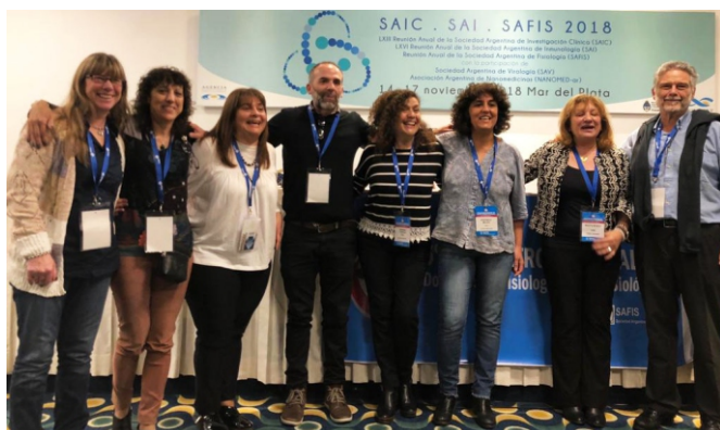
Comisión Educación SAFIS

La Comisión agradece a todos por su participación en el Encuentro.