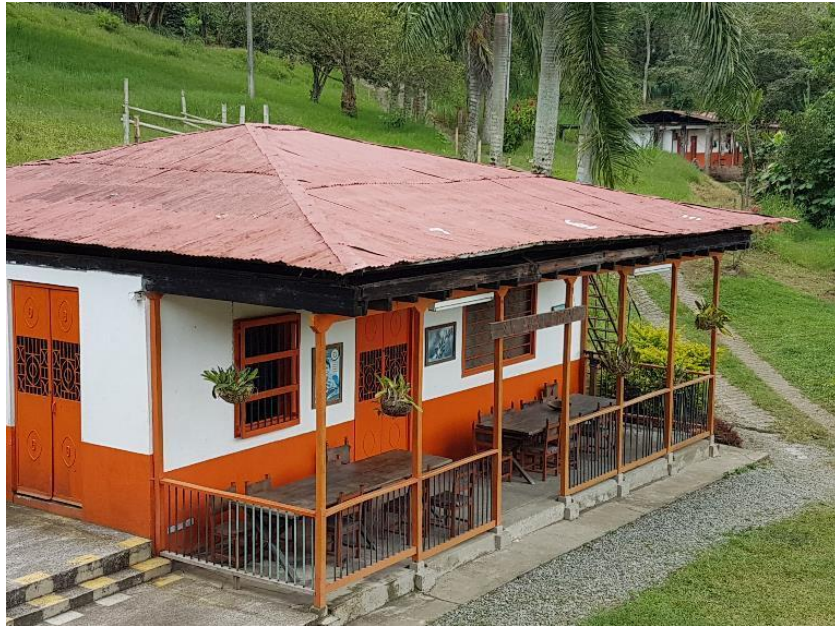
Imagen 7: Vista de finca cafetera “El Balcón”, Buenavista Quindío

en el marco de la declaratoria PCC - UNESCO anteriormente descrita; reconociendo conflictos e inercias que refuercen transformaciones virtuosas que permitan concretar territorios posibles, interpretando y resignificando identidades, necesidades y sueños .