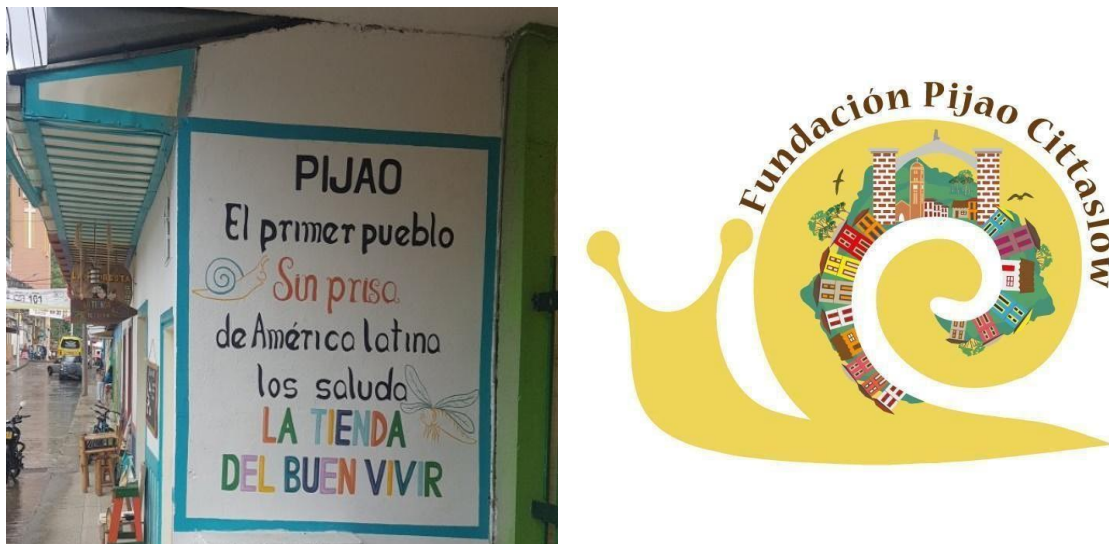
Imagen 9: Imagen de Pijao e Isologo

Su posición geográfica relativa, en función de la dinámica del territorio quindiano, se ve menos afectada por el fenómeno de turistificación y masificación de la práctica turística. El patrimonio histórico arquitectónico de Pijao está sujeto a diferentes presiones por parte de los nuevos modelos de turismo que allí se quieren implementar. Estos cambios en el patrimonio arquitectónico no obedecen a las dinámicas cotidianas ni a las necesidades de los pobladores locales, sino a lógicas exclusivamente economicistas.