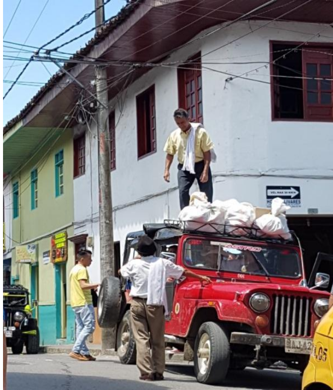
Imagen 6: Escena cotidiana de descarga de sacos de café