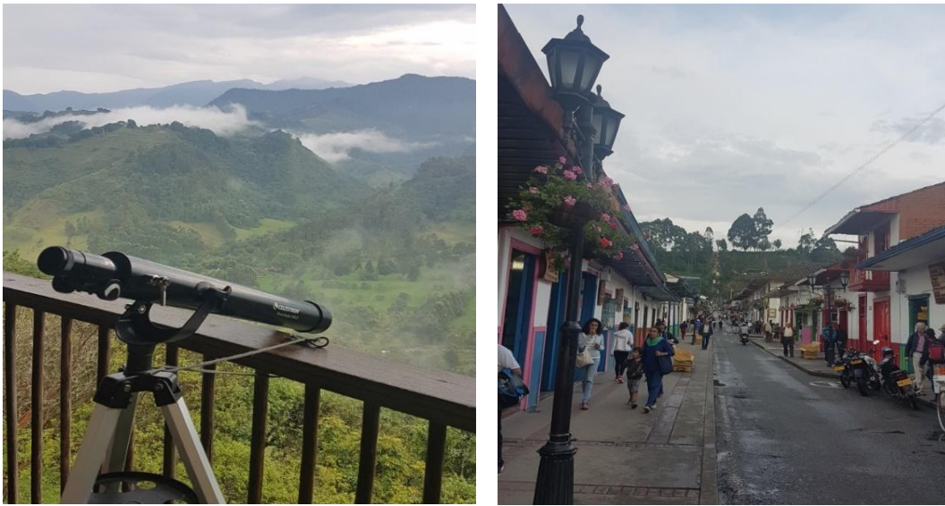
Imagen 8: Mirador de Salento y calle Real

Fuente: Fotografía Gliemmo, Fabricio. Febrero 2018