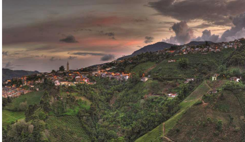
Imagen 2: Paisaje Cultural Cafetero Colombiano