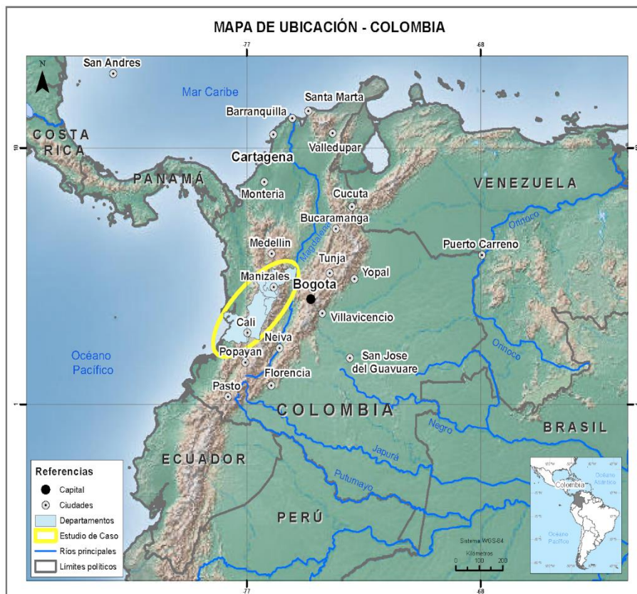
Imagen 1: Mapa de localización Colombia, Eje Cafetero

El caso que se desarrolla a continuación es una adaptación de la ponencia presentada en el “VII Congreso Nacional de Geografía de Universidades Públicas y XXI Jornadas de Geografía de la UNLP”, organizadas por la Facultad de Humanidades y Ciencias de la Educación entre los días 9, 10 y 11 de octubre de 2019, en la ciudad de La Plata.