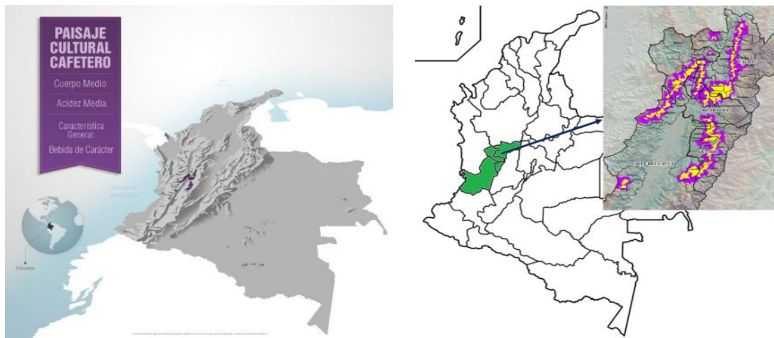
Imagen 3: Localización del Paisaje Cultural Cafetero Colombiano