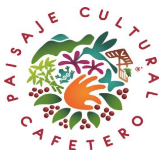
Imagen 4: Isologo que identifica al Paisaje Cultural Cafetero