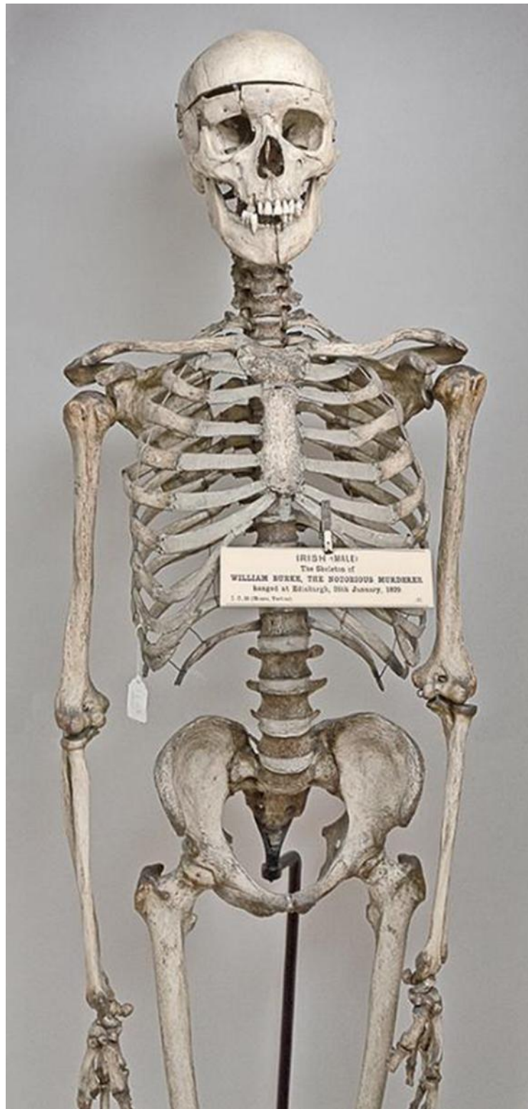
Fig. 2; Esqueleto montado de William Burke; Museo anatómico de la Escuela de Medicina de Edimburgo, Escocia.