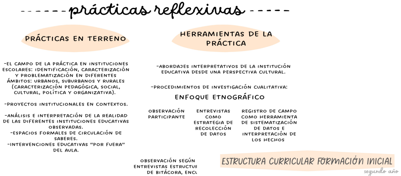
Imagen 2: Imagen 3: