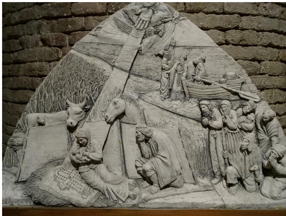
Figura 1 - Tímpano del Nacimiento - Año: 1999 - Artista: Gabriel Cercato - Material: cemento símil piedra - Técnica: Molde en barro con chamote, finalización con técnica del vaciado - Ubicación: Fachada / Portal izquierdo (Puerta de la Fe) de la Catedral Inmaculada Concepción, La Plata, Buenos Aires, Argentina.