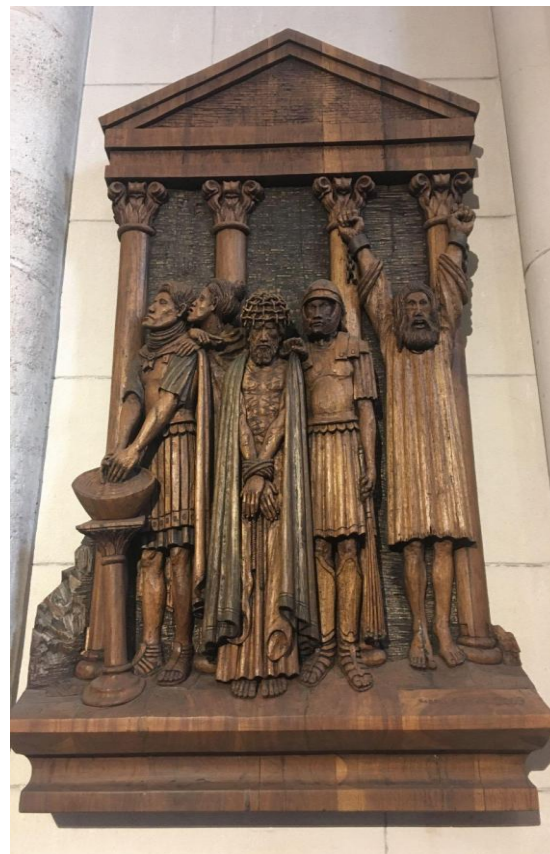
Figura 2 - Vía Crucis, Estación I: Jesús es condenado a muerte - Año: 2009 - Artista: Gabriel Cercato - Material: madera con tabloncillos encolados de petiribí patinados con cera negra - Técnica: talladas en