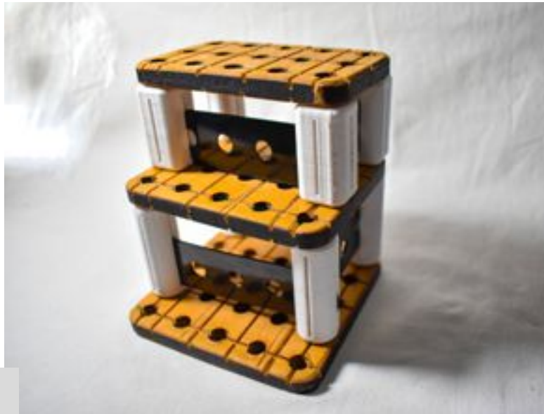
Figura 5. Construcción de un edificio en el prototipo

Con la ayuda de la impresión 3D, el usuario podrá imprimir por su cuenta nuevas piezas para ampliar su juego. De esta manera, el juego evolucionará en sí mismo y permitirá, mediante la posterior continuación de su desarrollo, generar nuevas piezas con nuevas combinaciones y composiciones [Figura 5].