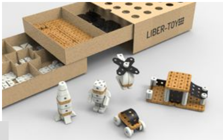
Figura 1. Presentación del juguete en formato render

Liber-toy es un juguete de construcción para niños y niñas generado a partir de impresión 3D. Su principio de juego fundamental es el encastre y la libertad de combinar los distintos elementos para generar múltiples combinaciones referentes a objetos reconocibles de la realidad. La propuesta es desarrollar un juguete para niños mayores de siete años que pueda servir como distracción ante el uso excesivo de Internet en el ámbito del hogar, estableciendo un momento de alejamiento de las pantallas, un óptimo descanso visual y un nuevo contacto con la tridimensionalidad de los objetos. El planteo del problema no corresponde a una batalla contra el uso de la tecnología, sino a una regulación del uso de la misma. La tecnología puede potenciar muchas habilidades cognitivas y promover el desarrollo del niño de diversas maneras pero su abuso es perjudicial. Por lo tanto, el desafío consiste en plantear un producto adecuado que sirva como atracción para aquellos niños que mantengan un contacto directo y caprichoso con la pantalla durante lapsos de tiempo prolongados [Figura 1].