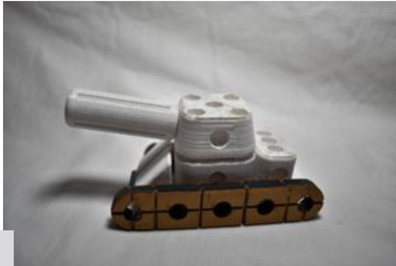
Figura 3. Construcción de un tanque de guerra en el prototipo

en composiciones diversas ubicadas en diferentes categorías, dando cuenta de los objetos más comunes presentes en algunos videojuegos y en elementos reconocibles de la realidad por los usuarios. El motor de generación es la creatividad e imaginación del usuario mediante un soporte de encastrés universales que haga posible la mayor cantidad de posibilidades [Figura 3].