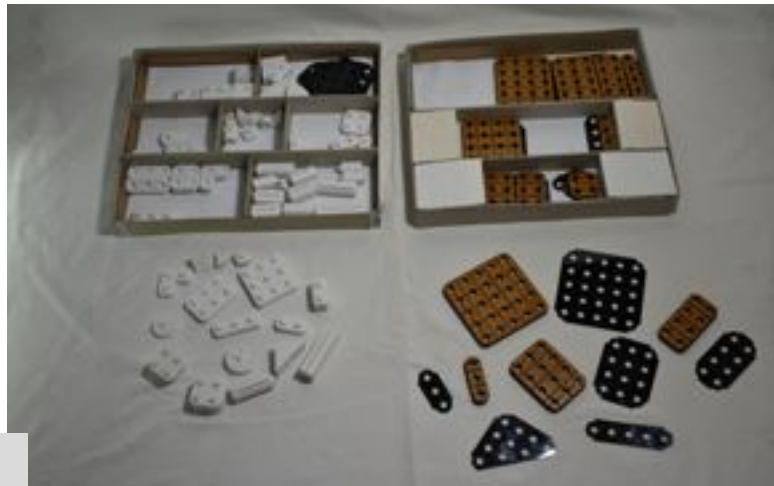
Figura 2. Piezas prototipadas exhibidas

El producto se compone de varias piezas de las que podemos reconocer 3 tipos: las plataformas de madera, las láminas de acetato y los bloques impresos en 3D de PLA. Se estima que todas las piezas de forma individual dan una cantidad de 50 unidades. No obstante, al ser un sistema y un juguete de construcción, se da la repetición de varias piezas para el mismo juego. Entre las construcciones posibles podemos encontrar vehículos terrestres, marinos y aéreos; estructuras tales como viviendas, refugios y edificios; personajes, humanoides, robots, criaturas; y las creaciones personalizadas que el usuario pueda generar mediante el uso de su creatividad [Figura 2].