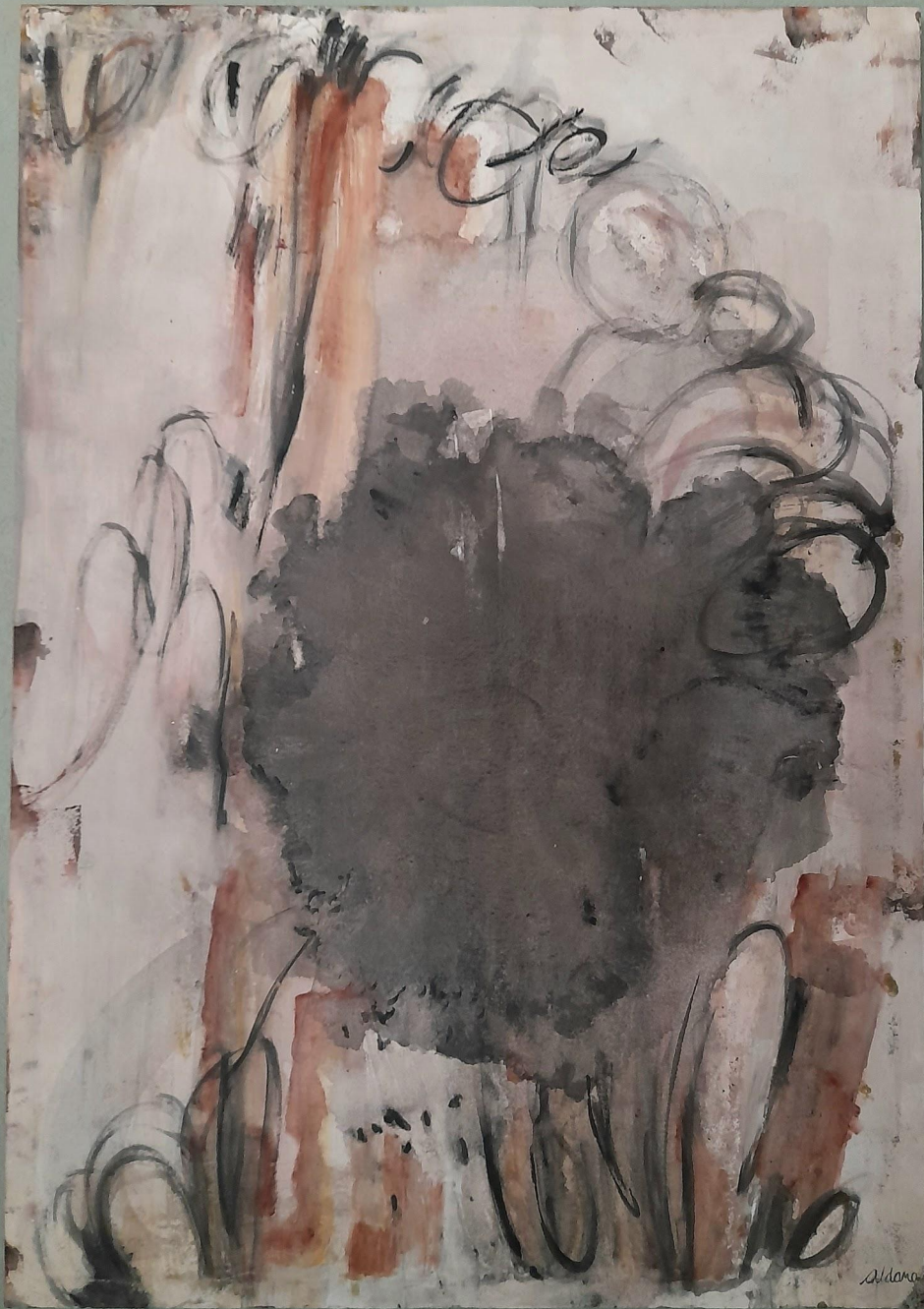
Obra N°4 Medio a la izquierda Técnica: acrílico sobre lienzo 1x70 cm