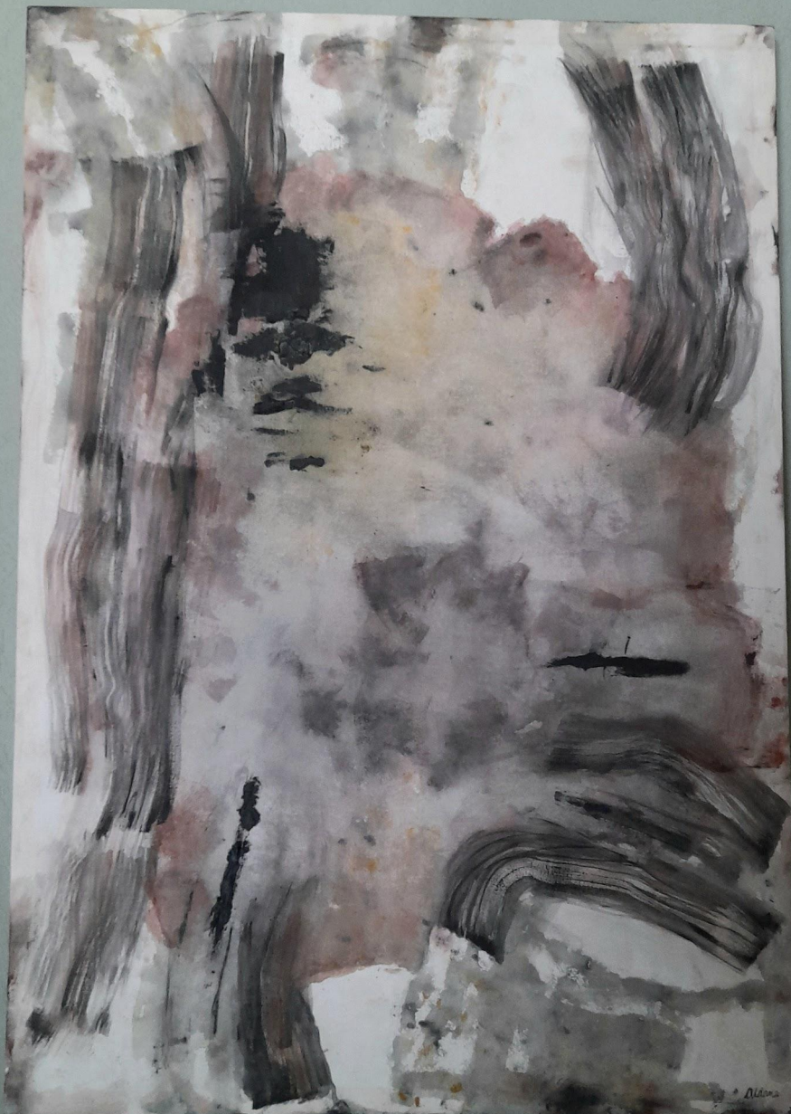
Obra N°7 Abajo a la izquierda Técnica: acrílico sobre lienzo 1x70 cm