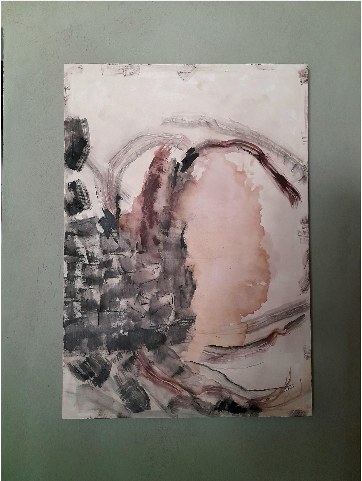
Obra N°2 Arriba al medio Técnica: acrílico sobre tela 1x70 cm