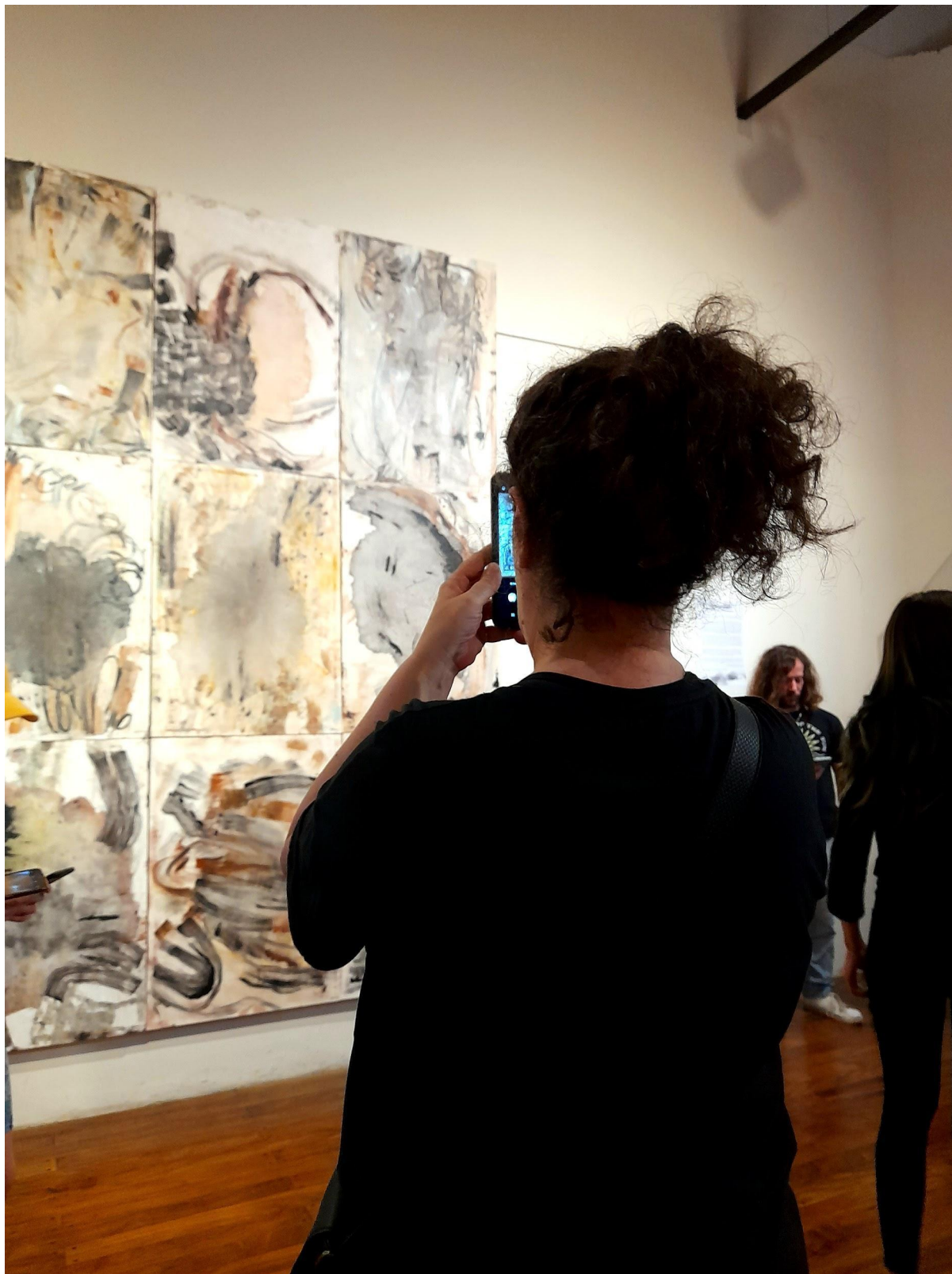
Apertura de la exposición