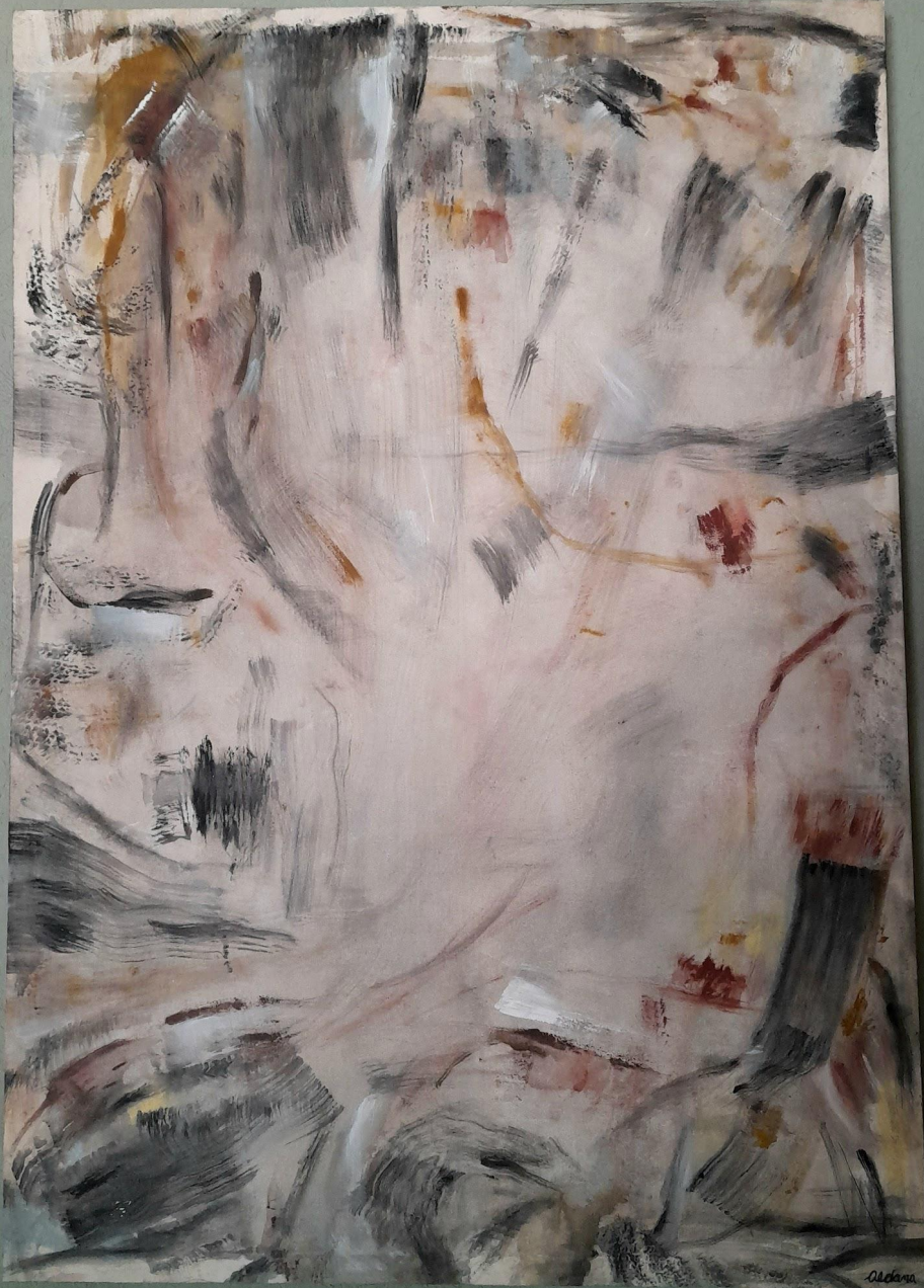
Obra N°1 Arriba a la izquierda Técnica: acrílico sobre tela 1x 70 cm