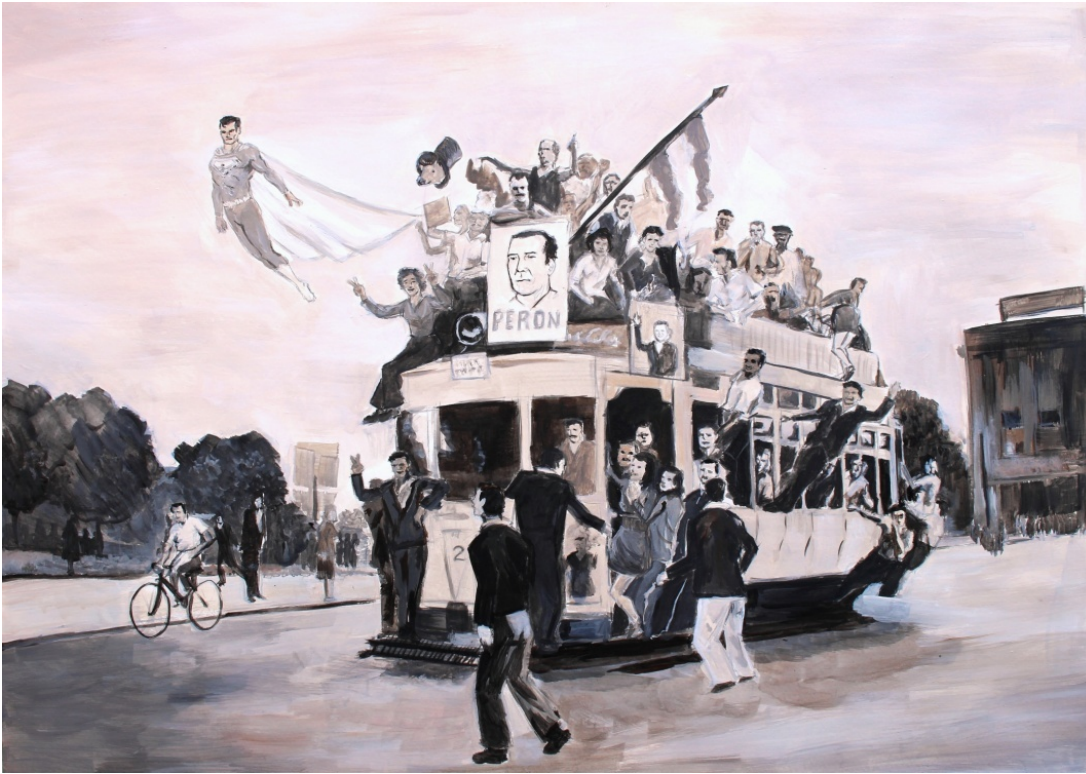
Figura 1 "Octubres" reproducción en afiche original formato 50x 70cm técnica mixta/ acrílico sobre papel