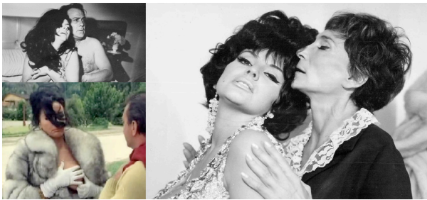
Fotogramas Fuego (Bo, 1969)