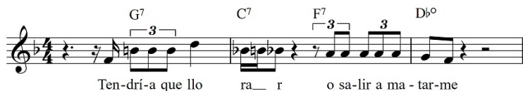
Figura 5. Verso final estribillo. «Un vestido y un amor» en Euforia (1997), Fito Páez. Concierto, Teatro Metropolitano, Ciudad de México

En la versión de Páez registrada en vivo en la Ciudad de México (1997) para la presentación de su álbum Euforia , la acentuación musical de la palabra salir en el segundo estribillo coincide con la prosodia de la misma, ya que la acentuación fuerte está dada en su segunda sílaba (primera corchea del tresillo del cuarto tiempo del compás) [Figura 5].