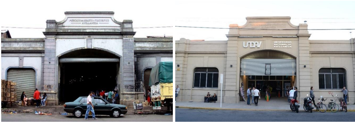
Fig.1.- Viejo Mercado de Abasto y Frigorífico de Avellaneda, 1930-2009. Nueva Sede España (Rectorado) de la Universidad Nacional de Avellaneda (UNDAV), 2010-Actualidad.

las sedes de la UNDAV, ex edificios de programas arquitectónicos productivos, que adoptamos como casos testigo de inmuebles considerados Patrimonio Histórico Arquitectónico Industrial.