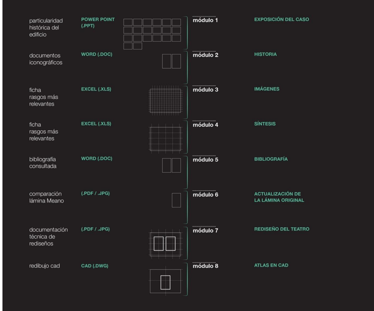
Figura 2. Etapas del Instructivo de Actualización. Módulo 1. Exposición del caso ; Módulo 2. Historia ; Módulo 3. Imágenes ; Módulo 4. Síntesis ; Módulo 5. Bibliografía ; Módulo 6. Actualización de la lámina original ; Módulo 7. Rediseño del teatro y Módulo 8. Atlas en AutoCAD .