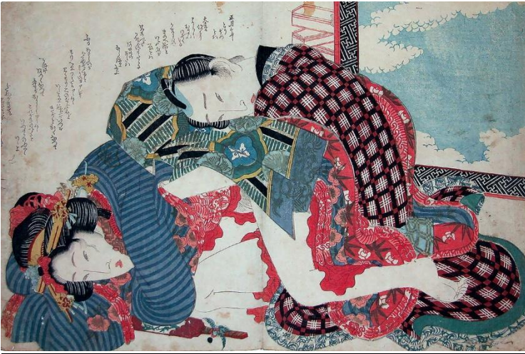
Eisen. Día de Año Nuevo (Día de Año Nuevo), 1835. Xilografía en papel. 16.5 x 37.6 cm (6 1/2 x 14 5/64 pulgadas).