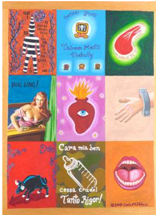
Políptico Trifásico Carla Molina Holmes