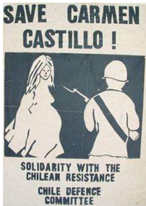
Comité Internacional de Solidaridad con Carmen Castillo