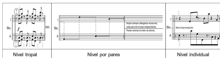
Figura 2. Niveles de uso de la técnica arka-ira . La Ciudad (1980), Cergio Prudencio.

La técnica arka-ira es utilizada de diferentes maneras a lo largo de la obra. En el caso de los sikus podemos distinguir tres niveles de uso: tropal , por pares e individual [Figura 2].