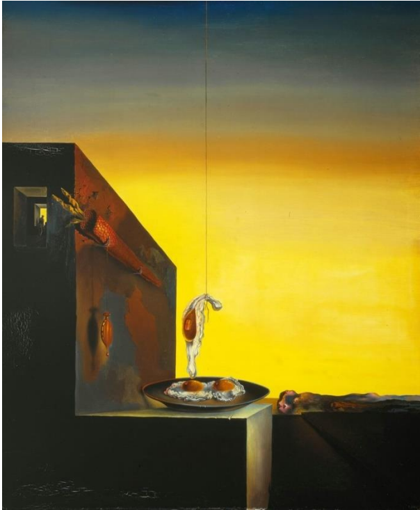
Huevos fritos en un plato sin plato