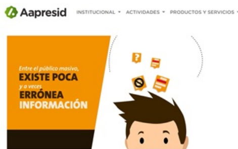
IMAGEN 4 Captura de pantalla spot institucional del Aula Aapresid (Aapresid, 2017)