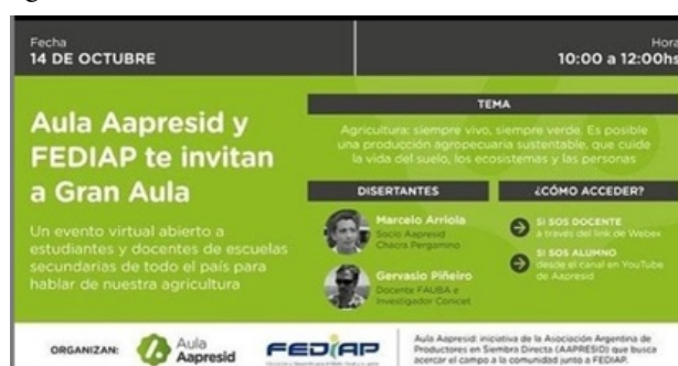
IMAGEN 5 Afiche institucional de Aula Aapresid. (Asociación Argentina de Productores en Siembra Directa, 2020a)

Con una dinámica que, por momentos, recordaba a la de un programa televisivo, 6 se invitó a los asistentes a utilizar una aplicación interactiva para responder en tiempo real a los interrogantes que los anfitriones hacían. Así, por ejemplo, se preguntó: “¿qué palabra se te viene a la mente cuando pensás en el campo y la actividad agropecuaria?”. Se comenzó luego a leer lo que los participantes habían escrito y se mostraba en la pantalla central del encuentro: “trabajo, productividad, tranquilidad, agricultura, ganadería, producción, naturaleza, alimento y vida, esfuerzo, ganadería, ¡mi papá! [con emoción], futuro, alegría, sustentabilidad, extensión, siembra directa, cultivos agrícolas, familia, progreso, soja, cultivos, animales” (Aapresid, 2020a). Los resultados en formato “nube” mostraban en mayor tamaño las palabras “trabajo” y “productividad”, lo que evidencia que eran las que los asistentes más habían contestado.