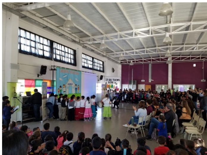
IMAGEN 2 Actividades en el marco de la tercera edición de “Así son los suelos de mi país”. (AACREA Córdoba Norte, 2019)

desarrollo de destrezas que aumentan la autonomía en el aprender [como también] habilidades sociales relacionadas con el trabajo en equipo, el planeamiento, la conducción, el monitoreo y la evaluación de las propias capacidades intelectuales, incluyendo resolución de problemas y hacer juicios de valor (Así son los suelos de mi país, 2021, p. 4).