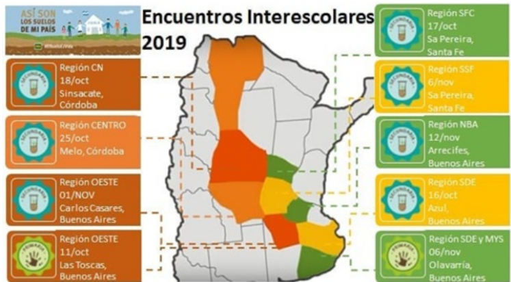
IMAGEN 1 Mapa de encuentros interescolares (AACREA, 2019)

Desde su puesta en marcha en 2017 participaron unos 3.500 estudiantes de escuelas de Buenos Aires, Córdoba, Santa Fe, La Pampa y Salta. Además, se brindaron diversas capacitaciones para los docentes integrantes –la edición 2021 fue, por ejemplo, sobre agua, cambio climático, residuos, producciones y ambiente–, luego de las cuales se organizaron encuentros interescolares. Estos últimos se replicaron durante el año en diferentes puntos del país donde los(as) estudiantes tuvieron oportunidad de compartir los resultados de sus trabajos de investigación, examinados por una mesa valorativa compuesta por expertos (ver Imagen 1).