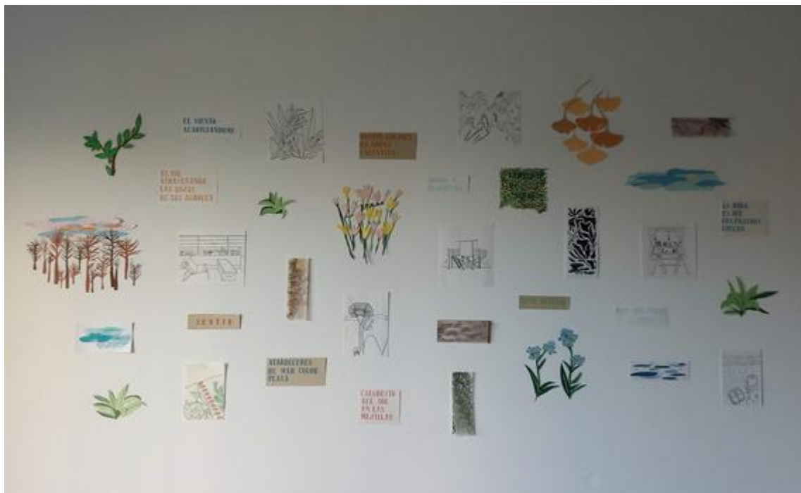
Figura 8: Constanza Atencio. Crear un lugar donde antes no existía (2021). Instalación. Montaje sobre muro.