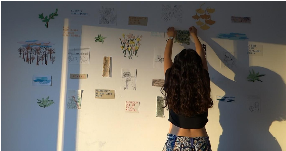
Figura 7: Constanza Atencio. Crear un lugar donde antes no existía (2021). Instalación. Montaje sobre muro . Recuperado de:

hacer mismo. Redescubrir y recrear, como una práctica poética, los gestos cotidianos que nos permiten crear un lugar propio.