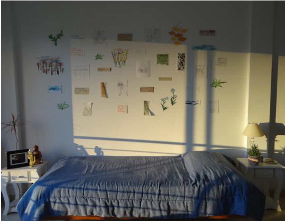
Figura 9: Constanza Atencio. Crear un lugar donde antes no existía (2021). Instalación. Montaje sobre muro.