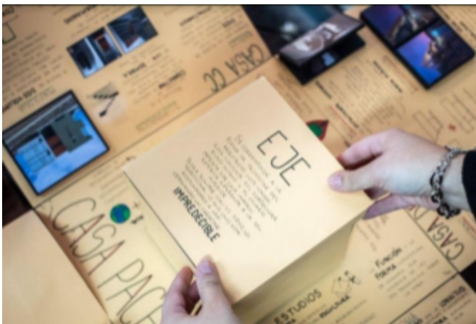
TP - Referentes

El aprendizaje en la Universidad depende, fundamentalmente, de la interacción entre docentes y alumnos. En el modelo convencional de enseñanza-aprendizaje, se entiende el carácter de la docencia como “decir a los estudiantes lo que se sabe sobre un tema”, omitiendo trabajar los saberes desde sus múltiples miradas (Charlot, 2008), las cuales pueden establecer modos de indagar, investigar, aprender y pensar en un área de estudio.