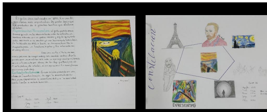
| Fig.3 y Fig.4. Algunos Trabajos sobre el Proceso creativo