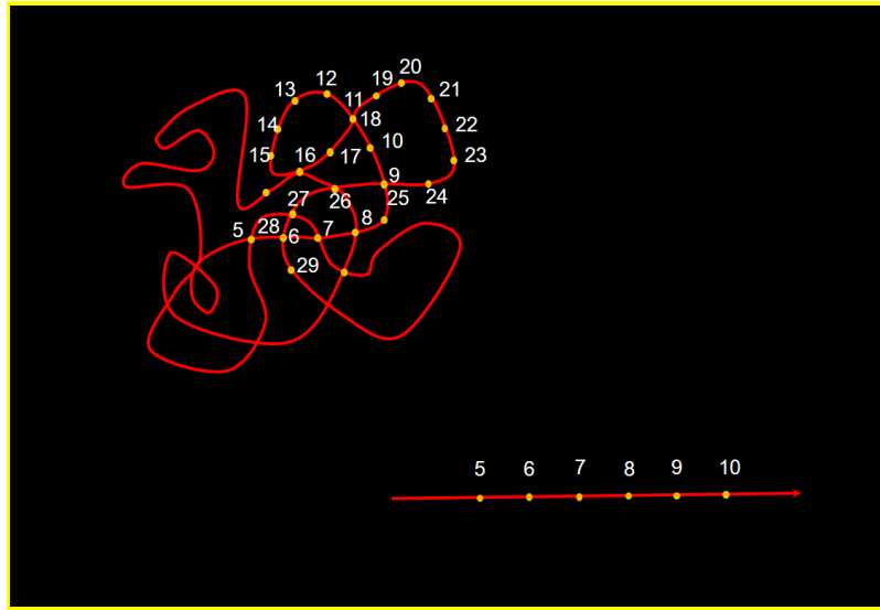
Fig 1. Esquema de noción de historia lineal frente a la no lineal.