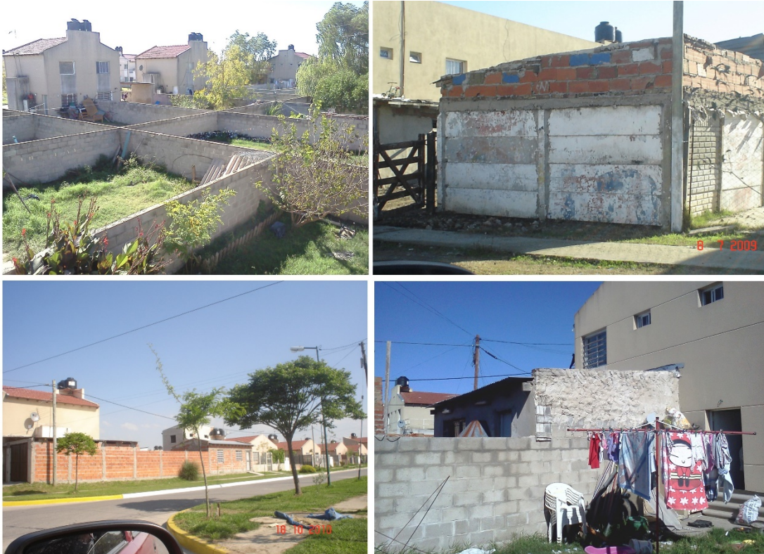
Figura 2: Primeras adaptaciones | año 2005