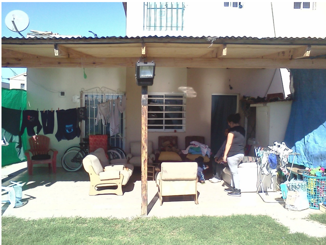
Figura 4: La galería como espacio polivalente