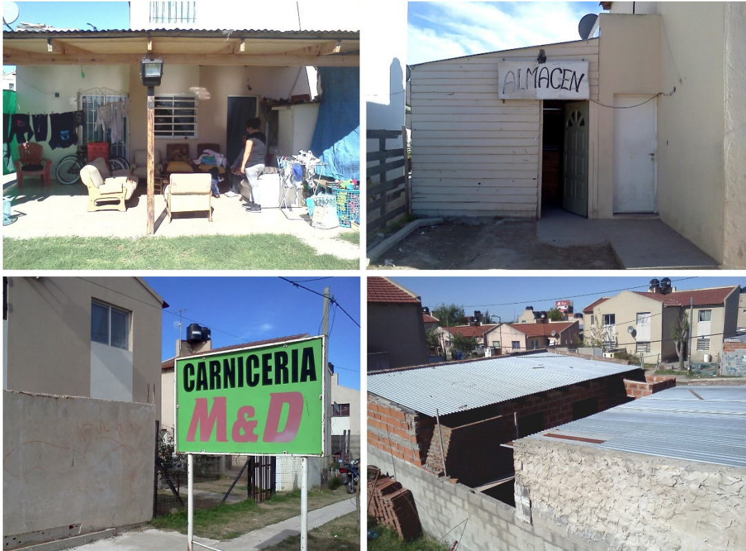
Figura 3: Adaptaciones posteriores | año 2007