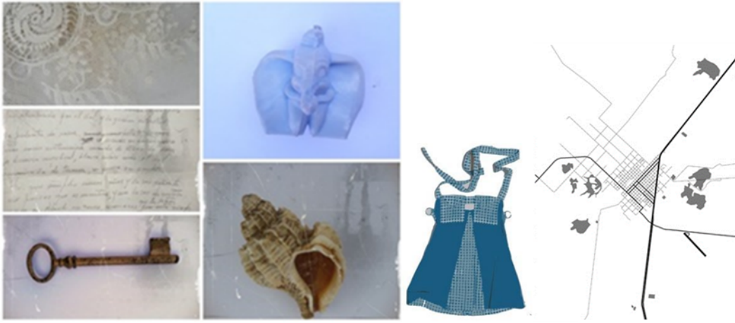
Plano de Maipú