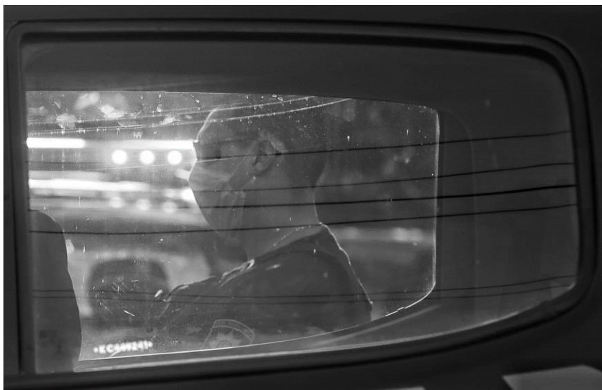
Manifestación de familiares de detenidos por las condiciones de detención y represión durante las protestas ocurridas en la Unidad Penitenciaria n° 2 de Santa Fe en el marco de la declaración del aislamiento social por el Covid-19, marzo 2020.