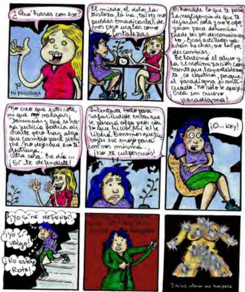
FIGURA 6 Interior de Una buena chica (Evi Zunz, 2020).