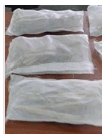
Figura 4: Bolsas para nuestro estudio, en proceso de armado, con hojas de totora seca lista para ser habitadas por los hongos acuáticos.

laboratorio. Allí se colocaron trozos de las hojas colonizadas en frascos con agua y burbujeo para facilitar la aireación, ya que sabemos que esto estimula la producción de las estructuras de reproducción. Después de 48 horas filtramos el agua e identificamos las esporas que se generaron. Luego de varias jornadas frente al microscopio nos encontramos con un total de 76 hongos acuáticos diferentes, ¡un montón! y vimos que cada uno de ellos había producido un número distinto de esporas. También descubrimos que los tipos de esporas pigmentadas (en general de color marrón) se encontraron en mayor número de especies que las transparentes. Además, las esporas