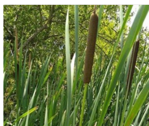
Figura 3: Hojas y flores de Totoras ( Typha latifolia ) observadas en los arroyos estudiados.

permiten que los podamos identificar y así saber de qué especie/tipo de hongo acuático se corresponde. Nos centramos en los hongos que colonizan hojas secas de una planta palustre conocida como totora ( Typha latifolia ), esta especie vegetal habita en zonas litorales de ríos, lagunas y bañados. Las hojas secas de esta planta fueron colocadas durante cuarenta días bajo el agua, para ser colonizadas por los hongos y posteriormente fueron retiradas para comenzar a estudiarlos. Es de destacar, que esta investigación no se llevó a cabo en cualquier parte de los arroyos sino en bañados de desborde fluvial. Estos sitios se localizan en sectores de los arroyos donde el curso de agua se expande por los desniveles del terreno, suelen tener un perímetro indefinido y abundante vegetación acuática. Estos ambientes tienen la capacidad de actuar como filtros naturales para los contaminantes que pueden transportar los ríos y arroyos. Para este estudio, se seleccionaron dos bañados en una zona rural, con buena calidad del agua (denominados