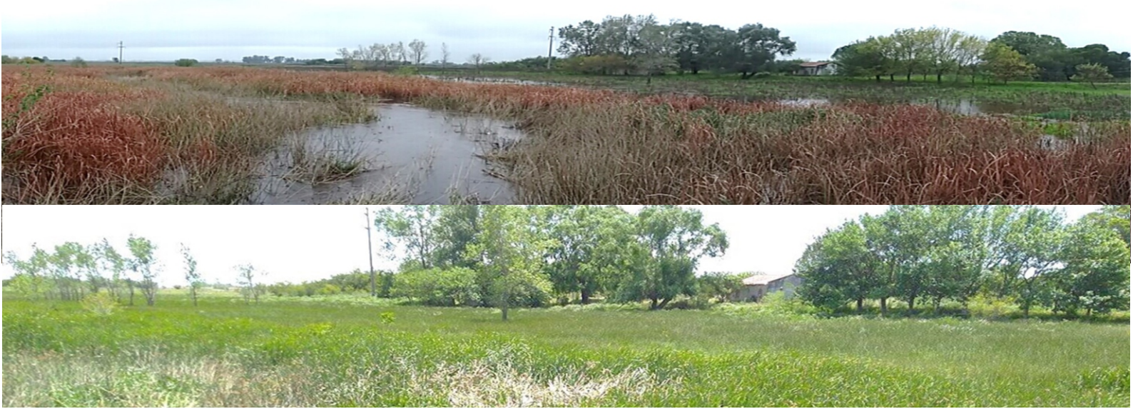
Figura 2: Arroyo Cajaravilla, donde se observa la gran cantidad de Totoras ( Typha latifolia ), en el tramo final del bañado de desborde fluvial.

permiten que los podamos identificar y así saber de qué especie/tipo de hongo acuático se corresponde. Nos centramos en los hongos que colonizan hojas secas de una planta palustre conocida como totora ( Typha latifolia ), esta especie vegetal habita en zonas litorales de ríos, lagunas y bañados. Las hojas secas de esta planta fueron colocadas durante cuarenta días bajo el agua, para ser colonizadas por los hongos y posteriormente fueron retiradas para comenzar a estudiarlos. Es de destacar, que esta investigación no se llevó a cabo en cualquier parte de los arroyos sino en bañados de desborde fluvial. Estos sitios se localizan en sectores de los arroyos donde el curso de agua se expande por los desniveles del terreno, suelen tener un perímetro indefinido y abundante vegetación acuática. Estos ambientes tienen la capacidad de actuar como filtros naturales para los contaminantes que pueden transportar los ríos y arroyos. Para este estudio, se seleccionaron dos bañados en una zona rural, con buena calidad del agua (denominados