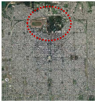
Figura 2: Aproximación al sector paseo del bosque y alrededores.

El recorte del trabajo se encuadra en un Paisaje de Atención Especial, puesto que es un elemento de identidad importante en la región. Se considera la relación entre las tres ciudades, La Plata-Berisso-Ensenada, a partir de un amplio sector que incluye grandes zonas de intercambio de flujos. El sector posee una condición particular con el paisaje circundante ya que se trata de un área de interés urbano-paisajístico, que además manifiesta ciertos conflictos físicos, ambientales y sociales con actores interjurisdiccionales del sector público y privado. A pesar de ello, expresa un gran potencial de desarrollo para la consolidación de la ciudad con su contexto regional, vinculado por la traza del eje fundacional de la ciudad de La Plata.