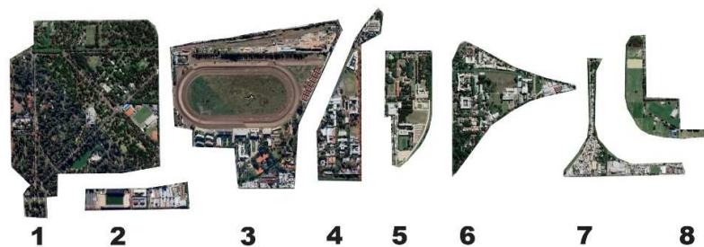
Figura 3: Áreas homogéneas (unidades de micropaisajes).

De esta manera, comenta Peries (2019), se establecen niveles de homogeneidad que determinan la subdivisión de la zona de estudio en áreas con caracteres diferenciados. El carácter de cada área es desarrollado en particular con información cuantitativa y cualitativa, donde se destacan aquellos componentes del paisaje con más relevancia que le dan carácter del paisaje.