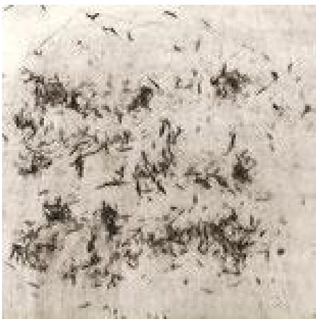
Fig. 1. Fragmento de Tratar un elefante (2009). Loson, E.

Con respecto a la elección del Libro de Artista (Beccaría et al, 2010) como dispositivo formal y poético me interesa recuperar la obra Tratar un elefante (Fig. 1) y algunas palabras de su autora, Elena Loson. Bien vale aclarar que esta obra es un registro en video, sin embargo, en su desarrollo encontramos recorridos factibles de abordarse desde el LA. Loson afirma que en el proceso de una obra nunca se puede volver al punto de partida. Esta condición de imposibilidad supone un continuo devenir en el proceso de producción, que en el caso de Tratar un elefante se manifiesta en la construcción de un relato a modo de secuencia. La obra consiste en un conjunto de imágenes que según la artista tienen como principios básicos “marcar, borrar, reescribir, volver a borrar, volver a dejar huella”. Cada nueva imagen contiene así, en sí misma, rastros de la anterior y de la siguiente, en un recorrido en el cual los límites de inicio y fin se desdibujan a la vez que se multiplican según el ojo que lo observe, y en donde lo significativo pasa a ser el proceso de construcción.