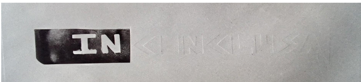
Fig. 3. Imagen de la producción personal (2021). Soto, Y.

El registro fotográfico y en video de los libros se encuentra disponible al público en https://inconclusa.wixsite.com/inconclusa