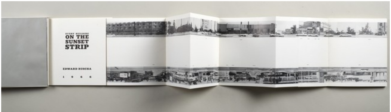
Fig. 2. Every Building on The Sunset Strip (1966). Ruscha, E.

Como referencia de ello podemos mencionar a Every Building on The Sunset Strip (Fig. 2), de Edward Ruscha. En este libro se aborda un formato específico que da cuenta de las posibilidades formales que supone el plegado en la construcción de un paisaje continuo, a la vez que se acentúa la poética del recorrido en la disposición de las fotografías en los márgenes superior e inferior.