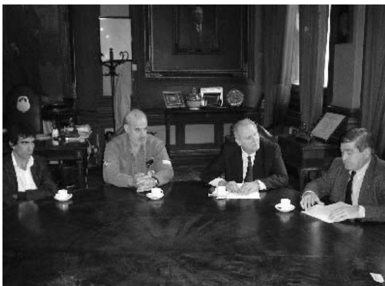
Azpiazu junto a las autoridades del Astillero Río Santiago

Las autoridades del Astillero Río Santiago firmaron en marzo de 2006 un convenio de cooperación con el presidente de la UNLP. Es el puntapié inicial para que, en el futuro cercano, se realicen acciones conjuntas. El objetivo es enfrentar la falta de mano de obra calificada.