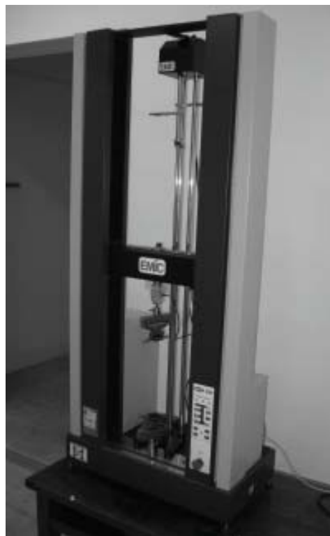
Máquina universal de ensayos, del Laboratorio de Investigaciones de Metalurgia Física

Se han implementado una serie de acciones referidas a la ejecución de recursos asignados en el marco de la operatoria PROMEI. En este sentido se adquirió y entregó a distintas Áreas Departamentales equipamiento tecnológico por la suma total de 275.369,68 pesos.