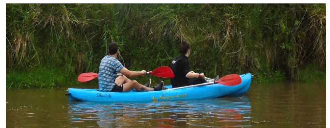
Fig. 1 - La conducta de asoleamiento de la tortuga de laguna se estudio mediante avistamientos realizados desde un kayak.

Los trabajos científicos surgen de hacernos nuevas preguntas a partir de estudios previos. Sabiendo que las tortugas de agua dedican parte de su tiempo a tomar sol con el fin de aumentar su temperatura corporal, secar su cuerpo y evitar enfermedades en la piel y caparazón, nos preguntamos ¿cómo se modifica la conducta de asoleamiento en la tortuga de laguna a lo largo del año en relación a la temperatura? ¿Qué tipo de superficie o sustrato prefiere? ¿Esta preferencia varía con el tamaño de las tortugas?