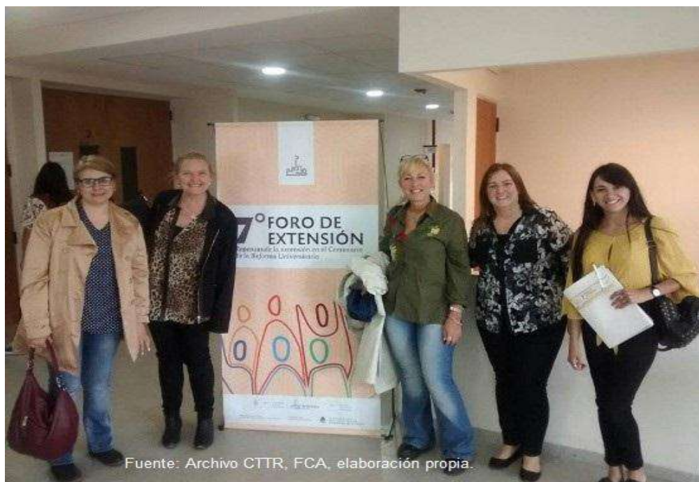
Figura 2: Equipo de docentes FCA, UNC en Congreso de Extensión Universitaria, 2018.

Se destaca como logro la propuesta y el dictado de la Diplomatura Diseño y Gestión de Emprendimientos de Turismo Rural: estrategias de agregado de valor a la producción agropecuaria reconocida con créditos universitarios. Se dictó en el interior provincial con una importante participación de estudiantes de los que surgieron más de 300 egresados. En esta experiencia, actores locales, productores rurales, emprendedores, docentes y funcionarios, presentaron trabajos finales de integración y transferencia (TRAFyT), entre los que expusieron y concretaron más de 30 proyectos regionales. En los mismos se plasmaron temáticas relacionadas con: el trabajo colaborativo, cultura, patrimonio, gastronomía, ecoturismo, desarrollo territorial, experiencias educativas, turismo inclusivo, sostenibilidad, empoderamiento de las mujeres rurales, entre otros (figura 3). Esta Diplomatura académica es la que posiciona a la FCA como pionera en la