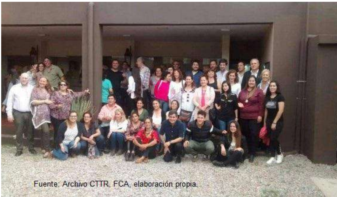
Figura 4: Grupo de estudiantes de Diplomatura Turismo Rural en Cruz del Eje

Fuente: Archivo CTRR, FCA, elaboración propia.