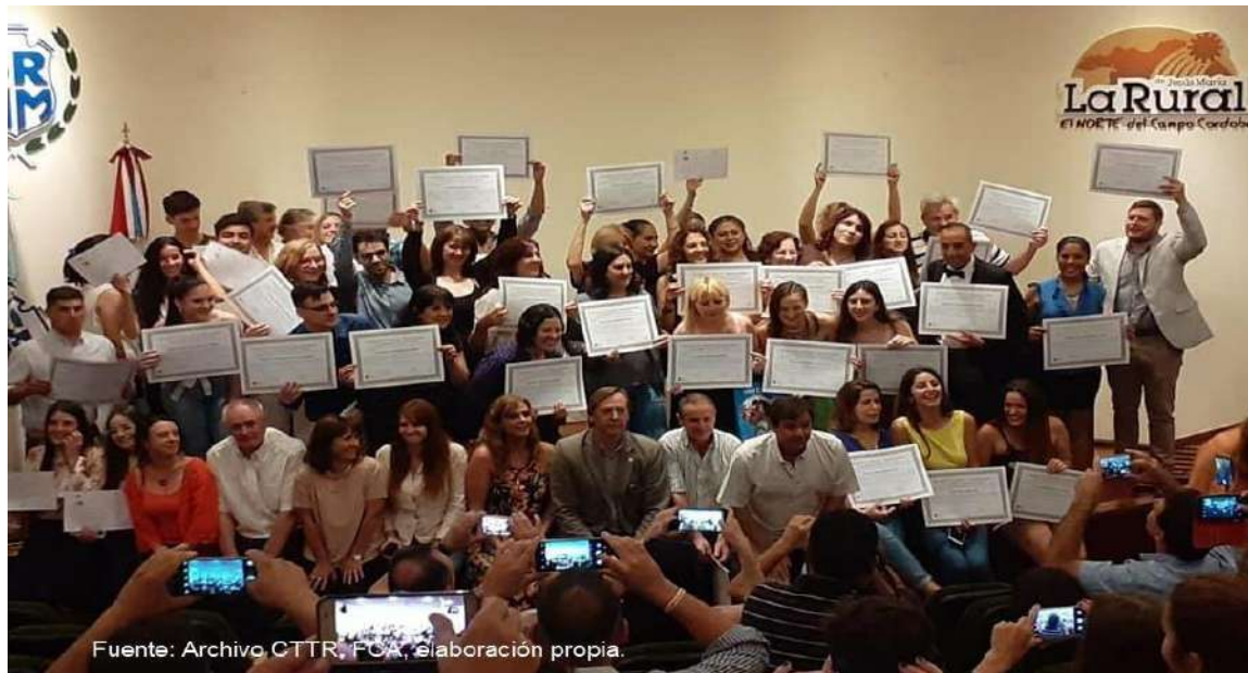
Figura 7: Taller de trabajo realizado con los alumnos de cuarto, quinto y sexto año de la escuela secundaria de la localidad de Las Calles.