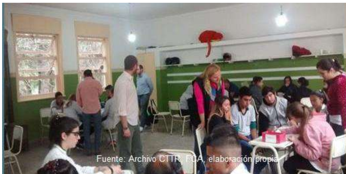
Figura 8: Feria en Las Calles, como parte del Plan de Desarrollo de Turismo Rural con identidad local, 2017 a 2020.