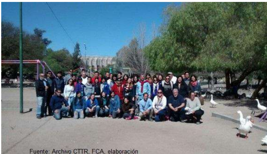
Figura 6: Entrega de diplomas quinta Cohorte Diplomatura Diseño y Gestión de Emprendimientos de Turismo Rural, Jesús María, Córdoba.