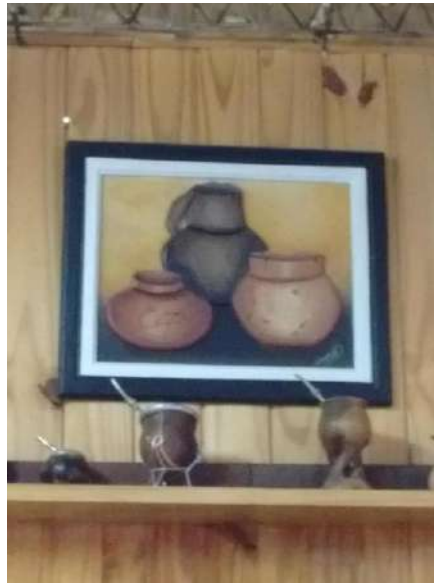
Fuente Fotográfica: Archivo personal de la autora. Producciones Artesanales de Nicolás Orquera. 2016