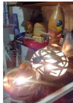
Fuente Fotográfica: Archivo personal de la autora. Producciones Artesanales de Graciela. 2016