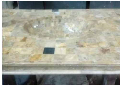
Producciones Artesanales de Roberto Lorenzo. 2016