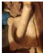
Producciones Artesanales de Ricardo Viera. 2016