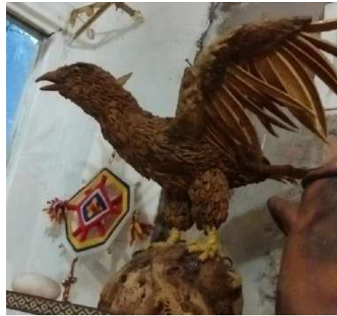
Producciones Artesanales de Pedro Becerra. 2016