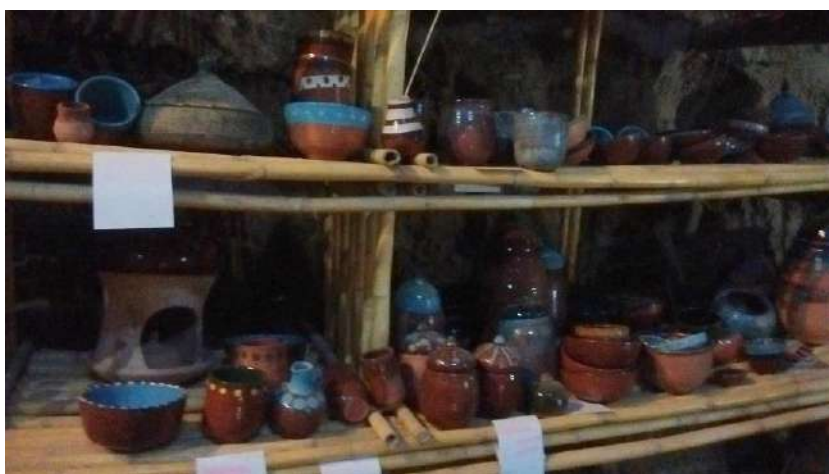
Producciones Artesanales de Luis Fernández