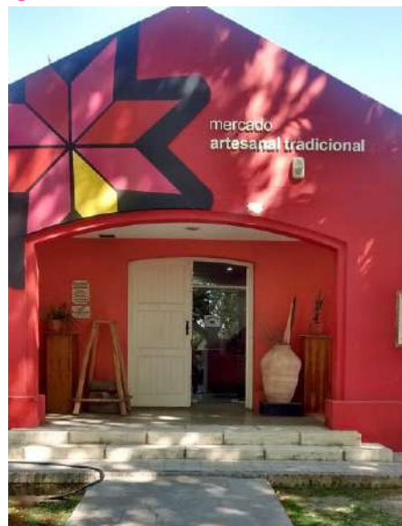
Imagen N°1: Mercado Artesanal Tradicional

Fuente Fotográfica: Archivo personal de la autora. Mercado Artesanal Tradicional. 2016